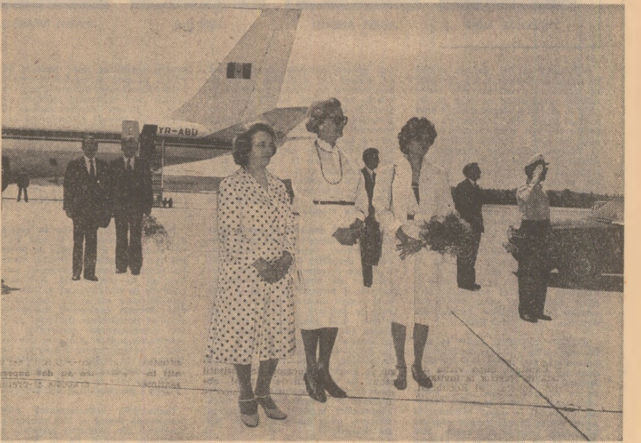
Momente de pe aeroportul internațional din Viena, înainte de decolarea avionului prezidențial