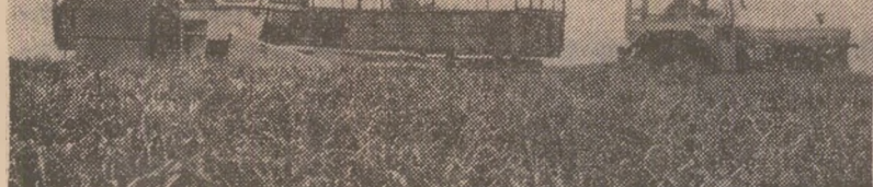
Recoltarea furajelor la I.A.S. Mogoșoaia, sectorul agricol llof

Dincolo de aceste aspecte, sînt de reținut și unele neajunsuri, ce mai există pe alături — lipsa unor piese de schimb, a anvelopelor și a cantităților necesare de combustibil — care pot perturba desfășurarea în ritm susținut a secerișului. Organele în drept și factorii de răspundere trebuie să soluționeze grabnic toate problemele de care depîndu buna pregătire a recoltării. Nici un orz nu trebuie precupțit acum pentru a asigura ca pîinea țării să fie strînsă și pusă la adăpost în timp și fără pierderi.