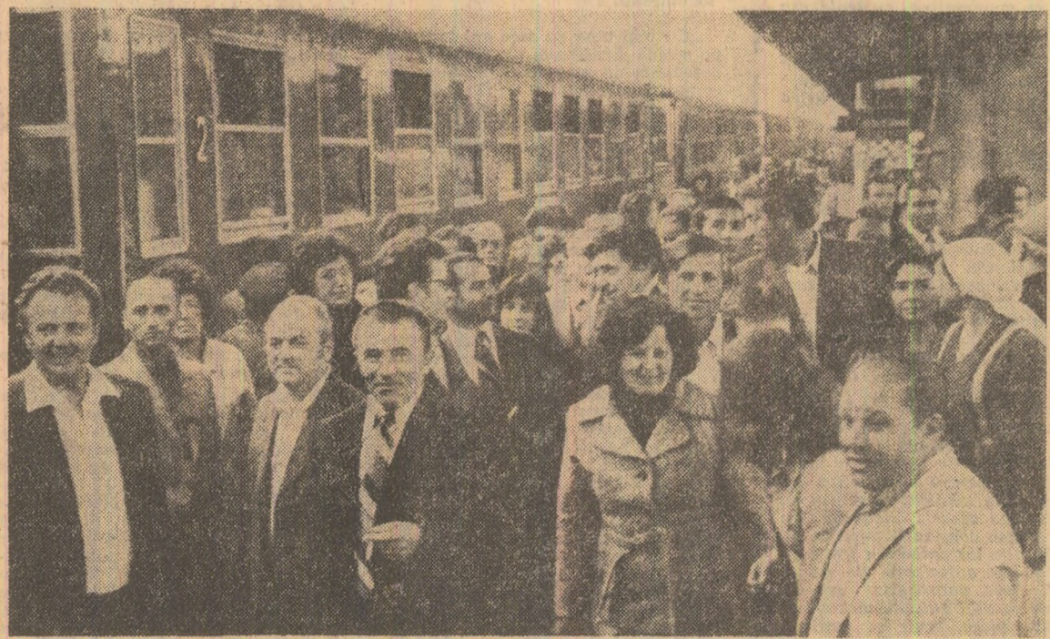
În Gara de Nord: aspect de la sosirea delegațiilor la congres

Astăzi, în jurul orei 9,00, posturile de radio și televiziune vor transmite în direct ședința de deschidere a Congresului al II-lea al consilierilor oamenilor muncii din industrie, construcții, transporturi, circulația mărfurilor și finanțe.