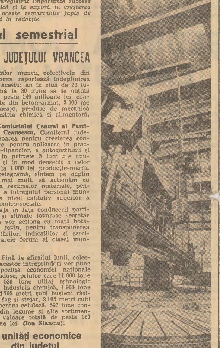
Modernul strung corusel de 16 metri, fabricat la I.M.U.A.B., spre strea tehnici a întreprinderii de mașini grele din Capitală

Pînă în prezent, un număr de 17 unități industriale din județul Alba au raportat îndeplinirea, înainte termen, a sarcinilor de plan pe 6 luni la producția-marfă, estimînd realizarea, peste prevederi, a unei producții suplimentare de 100 milioane lei. Printre unitățile participante se află Intreprinderea de produse refractare „Ardelena” și Uzina de utilaje metalice și reparatii din Alba Iulia, Combinatul de produse solide din Ocna Mures și Intreprinderea de prefabricate din beton Aiud. (Stefan Dinică).