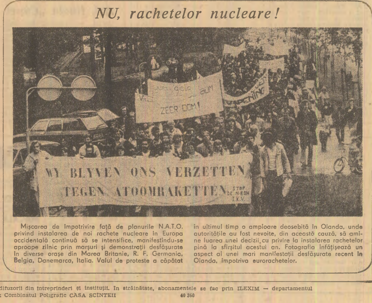
Mișcarea de împotriva față de planurile N.A.T.O. privind instalarea de rachete nucleare în Europa occidentală continuă să se intensifice, manifestându-se aproape zilnic prin mersuri și demonstrații desfășurate în diverse orașe din Marea Britanie, R. F. Germania, Belgia, Danemarca, Italia. Valul de proteste a căpătat în ultimul timp o amploare deosebită în Olanda, unde autoritățile au fost nevoite, din această cauză, să amâne luarea unei decizii cu privire la instalarea rachetelor până la sfârșitul acestui an. Fotografia înfățișează un aspect al unei mari manifestații desfășurate recent în Olanda, împotriva eurorachetelor.