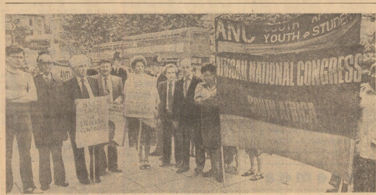
Demonstrație la Londra, cu prilejul Zilei de solidaritate cu lupta poporul din Africa de Sud împotriva apartheidului

tentativa senatorului Spadolini de a forma un nou cabinet pe bazele politice, programatice și structurale convenite pentru soluționarea diverselor crize pe care le traversează țara”, precizează agenția France Presse.