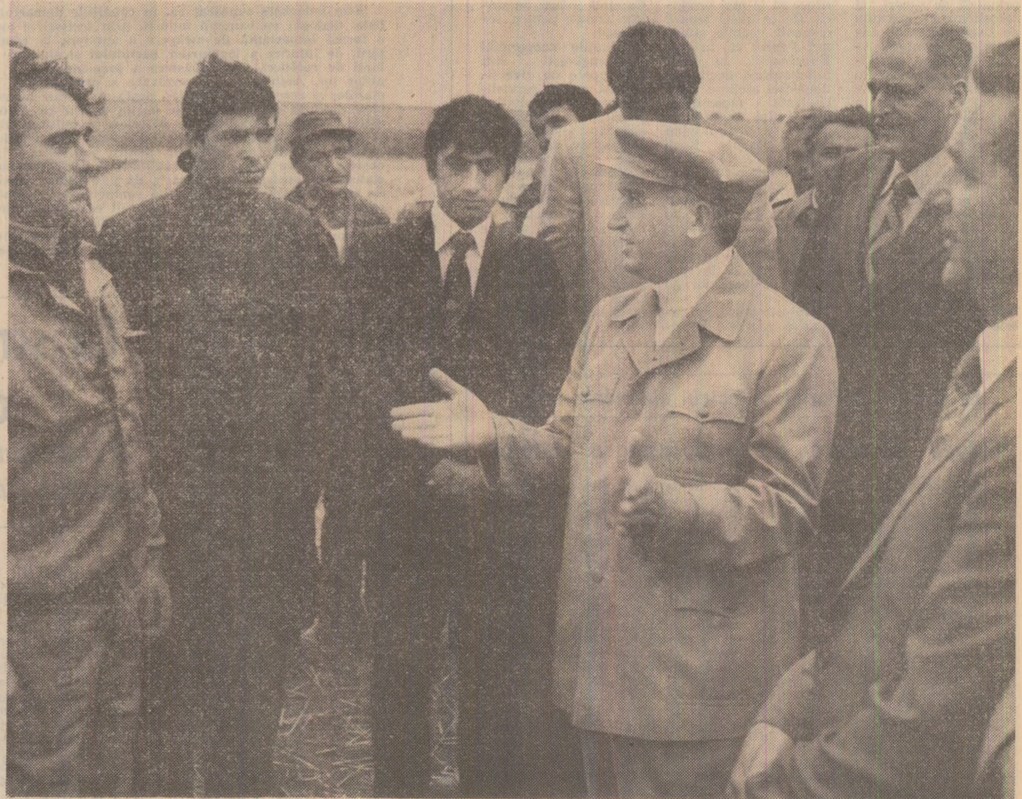
Cobadin: la marginea unui lan, dialog cu mecanizatorii aflați la lucru