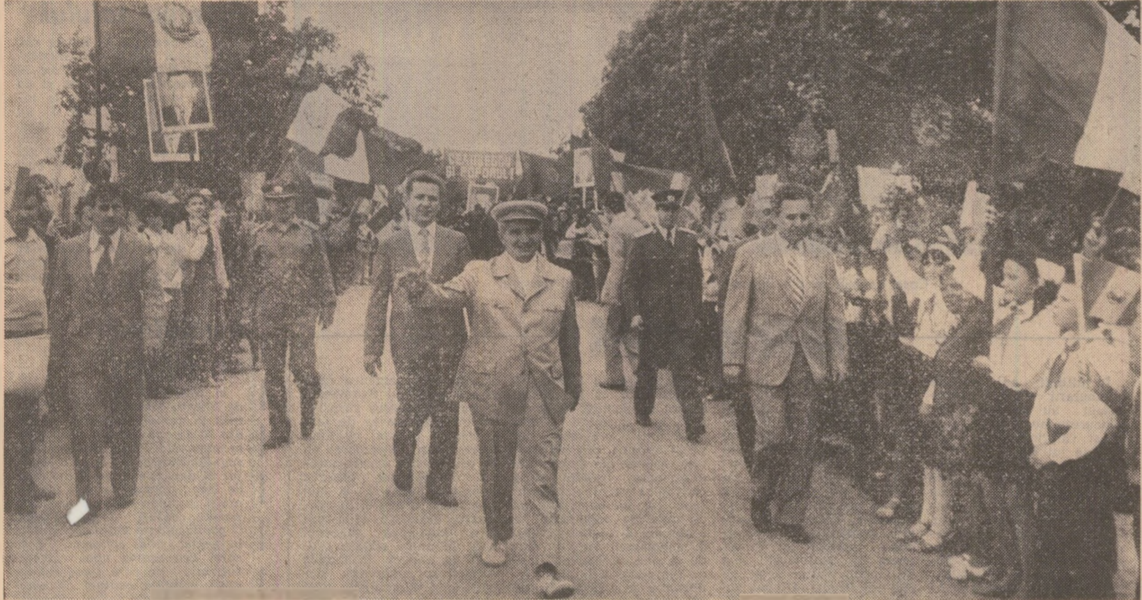
Colde, entuziaste manifestări ale dragostei și respectului față de conducătorul partidului și statului nostru