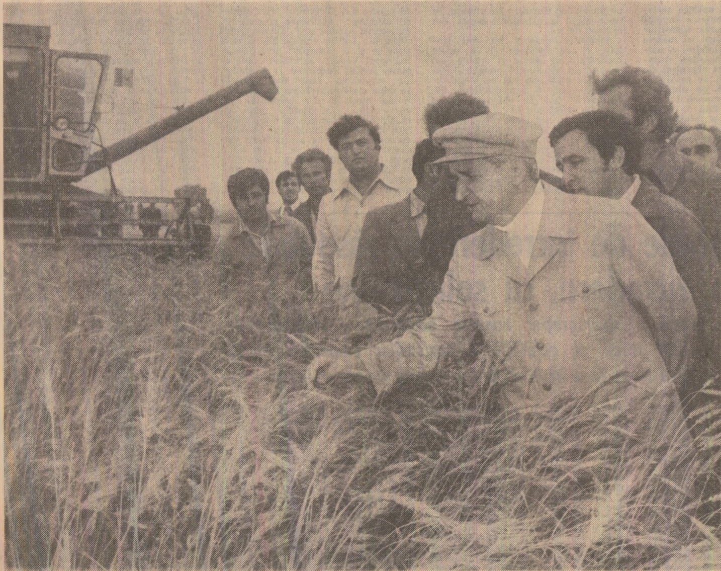
Într-un lan de grâu de la Cotu Văii

ÎN PREMIERĂ PE ȚARĂ. La Întreprinderea de postav „Proletarul” din Bacău a intrat în funcțiune un centru modern de sortare și prelucrare a materialelor rețosibile din industria ușoară, prima unitate de acest fel din țară. Înzestrat cu utilaje moderne și prevăzut cu un grad înalt de automatizare, el asigură anual prelucrarea unei cantități de circa 5.000 tone de materiale recuperabile, provenite de la întreprinderile de țesături, tricotate și confecții care folosesc ca materii prime fibrele sintetice în amestec cu fibrele naturale. (Gh. Bălă).