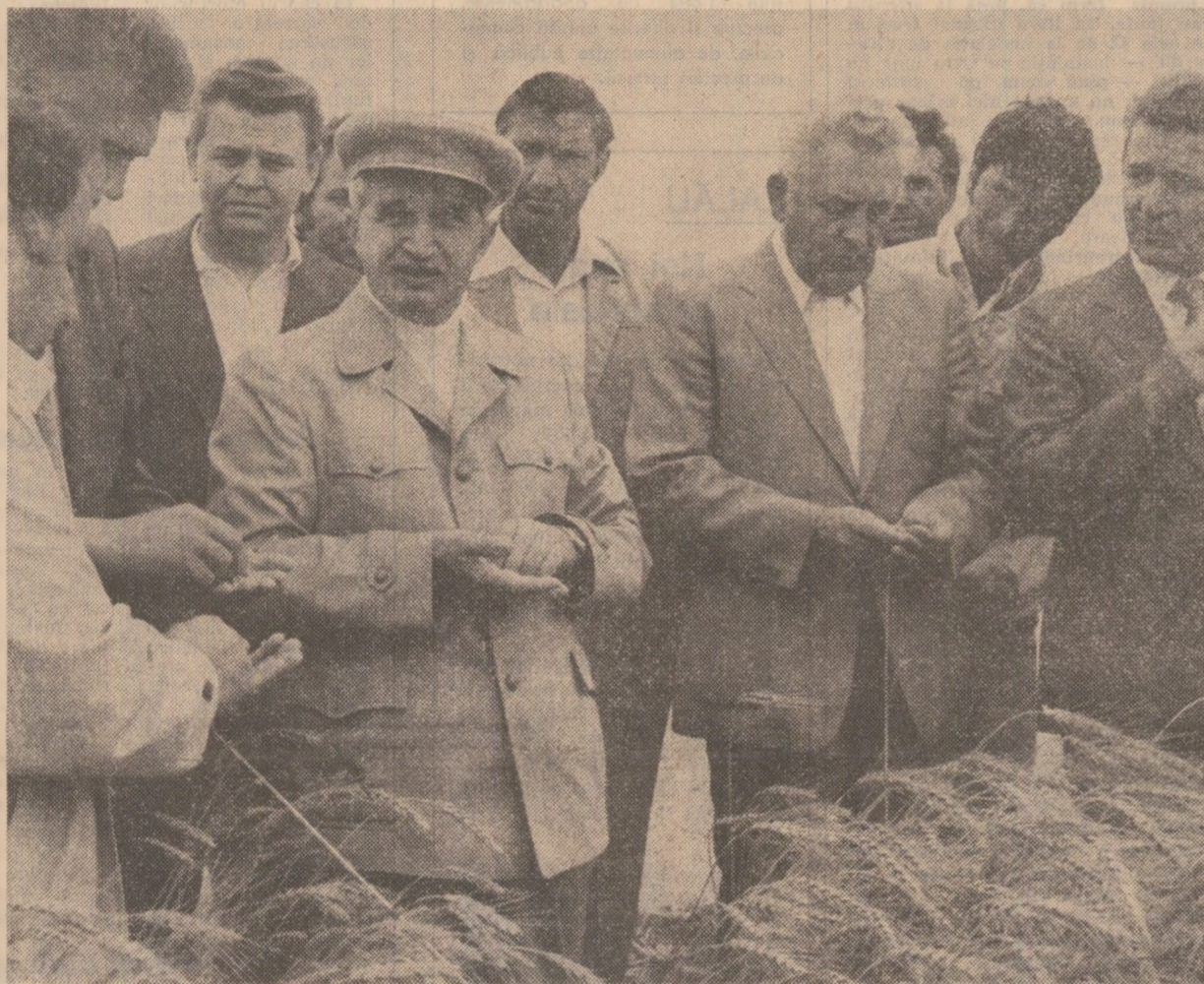
La cooperativa agricolă din Plopeni se examinează noua recoltă

tidului începe în perimetrul consiliilor unice agricole de stat și cooperatiste Albești și Negru Vodă și al cooperativei agricole din localitatea Cotu Văii . Elicopterul prezidențial aterizează în mijlocul cimpului, în apropierea unei sose de grâu, de pe care combinele string noua recoltă. În această ambianță de muncă susținută, sutele de mecanizatori, țărani cooperatori și școlari fac secretarului general al partidului o caldă primire, entuziasă manifestare a dragostei și respectului pe care le poartă conducătorului partidului și statului nostru. Se scândează neîntrerupt „Ceaușescu — P.C.R. — „Ceaușescu și poporul!”.