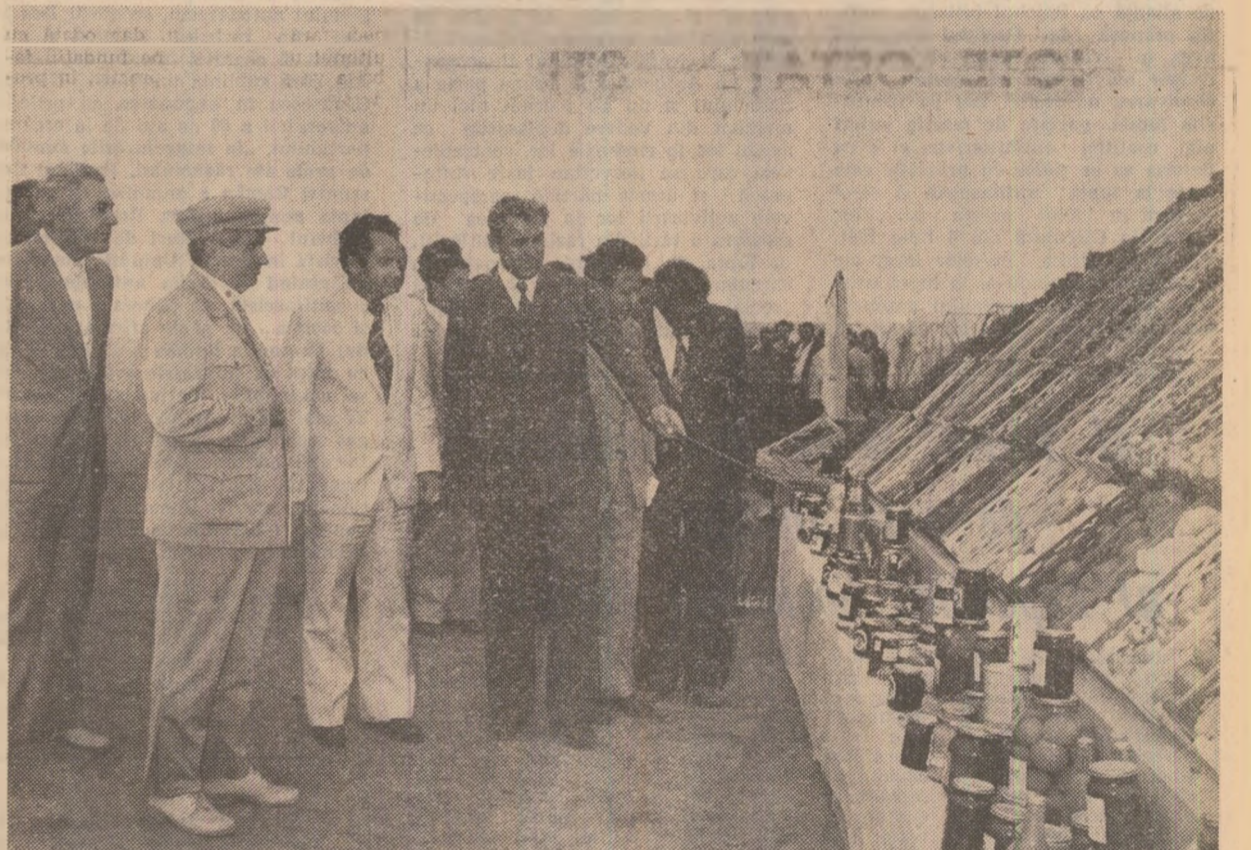
Se vizitează expoziția de legume, fructe și conserve de la complexul legumicol Poiana