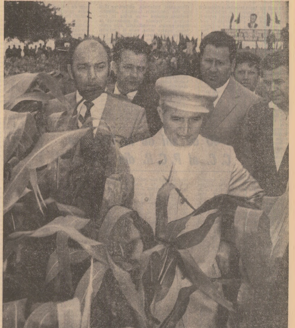
In lanurile de porumb de la I.A.S. Amacea

Tovarășul Nicolae Ceaușescu a răspuns cu prietenie manifestărilor pline de căldură cu care a fost înconjurat pe tot parcursul vizitei.