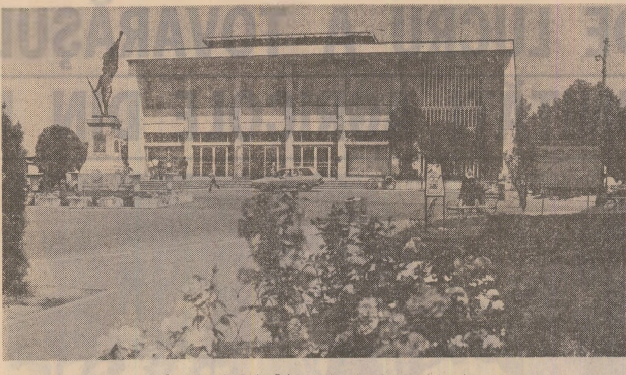
Casa de cultură din Buhuși, centru de educație al orașului

Urmărind cu consecvență linia de raliere a tuturor forțelor antihitleriste, P.C.R. a pus în centrul activității sale înfăptuirea unității de acțiune a clasei muncitoare, Comunistii trebuiau să lupte alături de vîrștii pentru o viață mai fericită, pentru dreptul la muncă, cultură și libertate, pentru zdrobirea lui Hitler... Soldații să treacă de partea Armatei Roșii și să întoarcă armele împotriva ocupanților fasciști”.