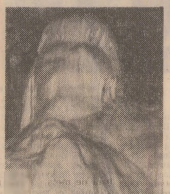
cele două chipuri din fotografie chiar dacă nu sînt prea... peșe — se contopesc, sugerînd imaginea unei ființe bicefal, ca trăsături antropomorfe. Dar cel mai bine e să vedeți însăși această minune a naturii care este Peștera urșilor.

„Sculptura” din imagine — reprodusă de fotoreporterul orădean Ștefan Vildar — este doar un „exponat” din bogatul și mirificul „muzeu de crițe” creat de către scutista natură. Unde? În Peștera urșilor de la Chișcău (în Apeninii bihoreni). După cum se poate vedea,