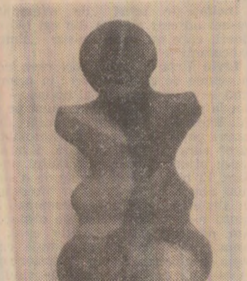
ceava, în locul numit „Dealul la Bocăneș”. Piesa va face parte dintr-un mic muzeu ce se va inaugura curînd în acest sat.