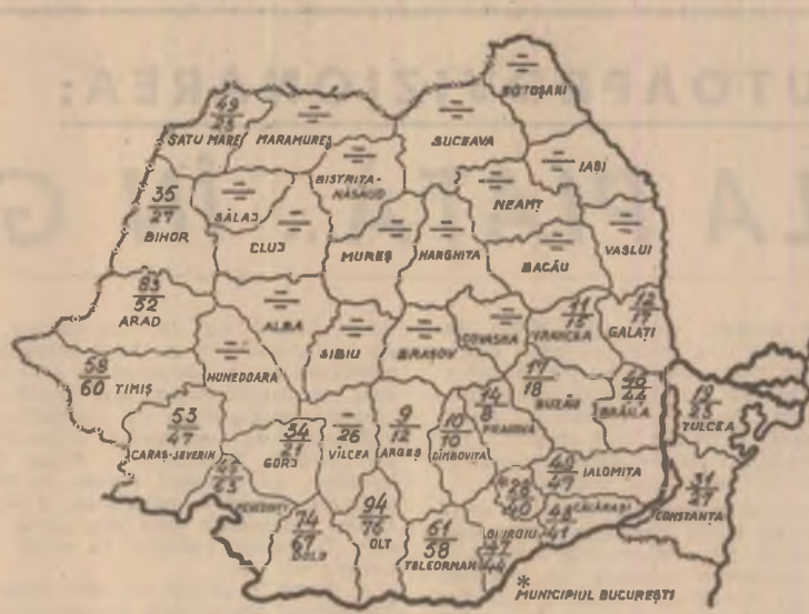
STADIUL RECOLTĂRII GRÎULUI ÎN SEARA ZILEI DE 10 IULIE. Cifrele înscrise pe hartă reprezintă, în procente, suprafețele recoltate în întreprinderi agricole de stat (cifra de sus) și în cooperativele agricole (cifra de jos).

Grîul mai este de recoltat de pe mari suprafețe. Timpul presează și pentru a se stringe cât mai repede și fără pierderi întreaga recoltă, este necesar ca pretutindeni, unde lanțurile de grîu s-au copleșit, să se lucreze zi de zi — inclusiv astăzi, duminică — la nivelul maxim al posibilităților, cu toate mijloacele mecanice și forțele umane de la sate. În fiecare unitate, în fiecare consiliu agroindustrial trebuie să se lucreze oră de oră din zori și pînă în noapte, ci mai bine organizat, asigurîndu-se toate condițiile, tot ceea ce este necesar pentru ca activitatea mecanizatorilor, a celor care transportă grîul din cîmp și a lucrătorilor de la bazele de recepție să se desfășoare fără întrerupere.