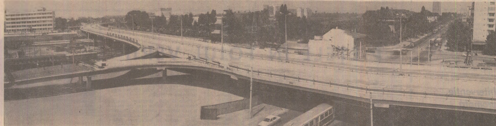
Noul pod Grant din Capitală