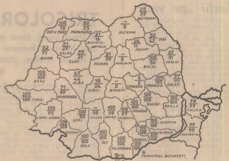
STADIUL RECOLTĂRII GRÎULUI ÎN SEARA ZILEI DE 23 IULIE. Cifrele înscrise pe hartă reprezintă, în procento, suprafețele recoltate în întreprinderile agricole de stat (cifra de sus) și în cooperativate agricole (cifra de jos). Întreprinderile agricole de stat din județele notate cu o linie nu cultivă grîu. În cursul zilei de ieri au încheiat secerișul și unitățile agricole de stat și cooperatiste din județele Constanța, Dimbovița, Tulcea și Vâlcea.

În următoarele zile este absolut necesar ca secerișul grâului să fie încheiat pe cele 300.000 hectare rămase nerecoltate, suprafață ce se află în județele situate în nordul și centrul țării, unde cerealele se coc mai tîrziu, iar ploile au împiedicat o vreme desfășurarea normală a lucrărilor în lanuri. Chiar dacă în unele din aceste județe condițiile de lucru la seceriș sînt mai grele — terenuri situate în pantă, frecvență mai mare a precipitațiilor — tocmai în asemenea situații se verifică cel mai bine forța de mobilizare a organizațiilor de partid, capacitatea organizatorică a cadrelor de conducere și specialiştilor din unitățile agricole. Sub nici un motiv nu se mai poate aștepta, deoarece orice