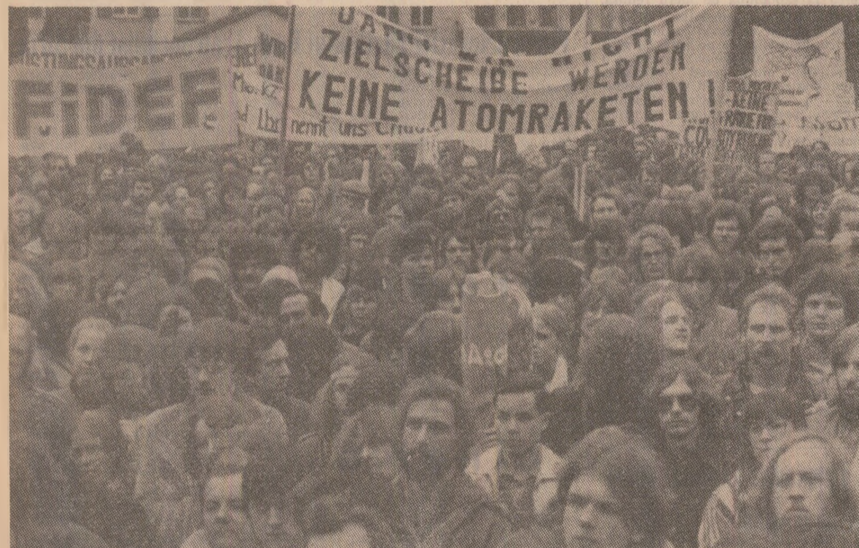
Ample demonstrații de protest împotriva proiectelor N.A.T.O. de instalare a noi rachete nucleare în Europa occidentală continuă să se desfășoare în diferite țări vest-europene. Fotografia de mai sus înfățișează un aspect de la o demonstrație care a avut loc recent în R. F. Germania

OSLO 24 (Agerpres). — Conducerea Partidului Socialist de Stînga din Norvegia a cerut guvernului norvegian să elaboreze un plan de acțiune pentru crearea unei zone denuclearizate în nordul Europei. Norvegia — se arată în apel — tre-