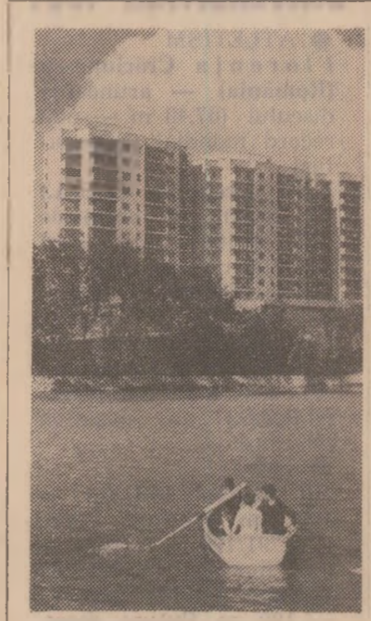
Cine ar mai putea recunoaște astăzi municipiul Sfinți Gheorghe, vechitul târg prăfuit de oșteni, în această imagine — una din multe altele care înfățișează noua și modernă lui arhitectură? El se înalță viguros pe cele două mături ale Oltului, devenind un nou centru industrial și spiritual al țării. Odată cu puternica sa platformă industrială, s-au construit din temelii noi cartiere, s-au dat în folosință numeroase dotări sociale, culturale, sanitare, comerciale și edilitare. O cifră; în cincinalul trecut s-au construit în municipiul Sfinți Gheorghe aproape 12.000 de apartamente. Numai numărul de locuitori ai noilor cartiere „Lenin” și „Gării” este mai mare decât al întregului oraș de acum un deceniu și jumătate. În actualul cincinal, municipiul va cunoaște o înflorire și mai puternică. (Pălănos Maria).