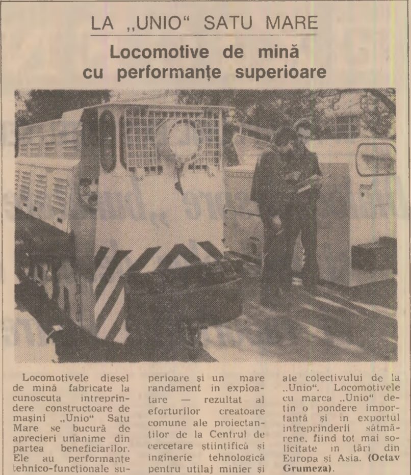
Locomotivele diesel de mina fabricate la acest combinat sunt cunoscute în întreaga țară...

Ca urmare, sonda a fost pusă în funcțiune cu trei luni de zile mai devreme, cîștigîndu-se o producție de circa 8.000 tone petrol.