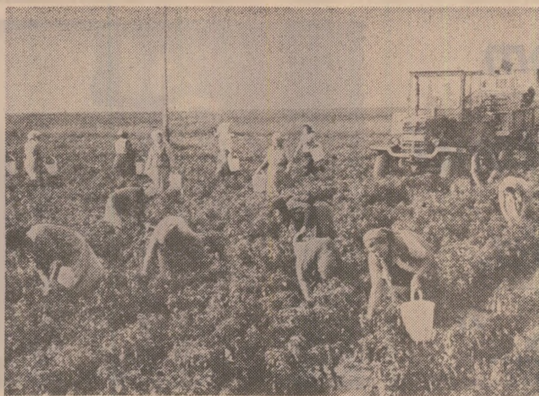
Cooperanții teoramaneni — mobilizați în aceste zile la recoltarea legumelor.