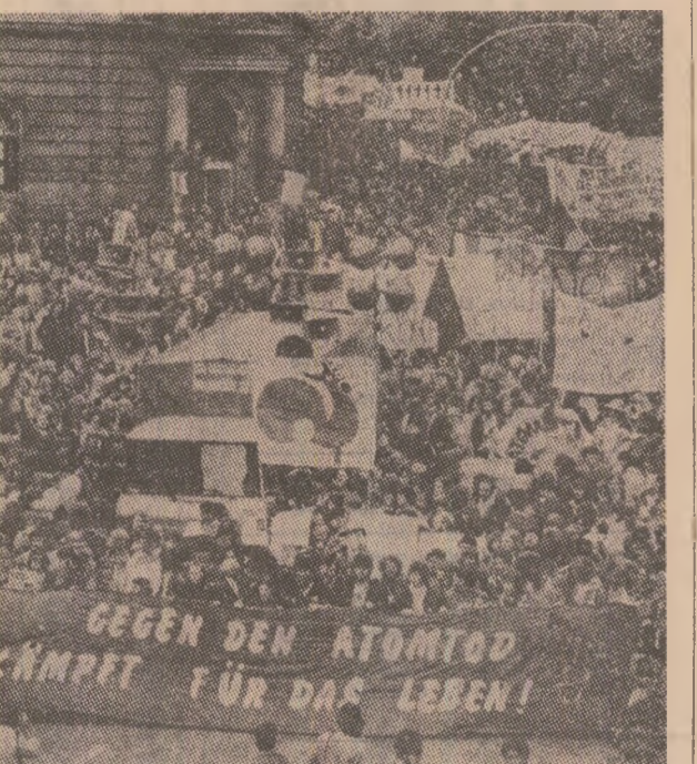
„Împotriva morții atomice, luptați pentru viață”: demonstrație de masă la Hamburg în sprijinul dezarmării nucleare

Un loc central în aceste dezbateri îl ocupă hotărîrea N.A.T.O. din 12 decembrie 1979, care prevede instalarea de noi rachete nucleare în Europa occidentală, cea mai mare parte a acestor armamente urmînd să fie amplasate pe teritoriul R.F.G. După opinia fostului ministru federal Erhard Eppler, deputat al P.S.D. în Dieta landului Baden Württemberg, care a devenit „amintitorul mișcărilor protestatară” („HANNOVISCHER ALLGEMEINE”), tinerii, componenta cea mai activă a mișcării pentru pace, consideră „absurde afirmațiile că trebuie să se recurgă la înarmare pentru a putea, cine tie cînd, să se treacă la dezarmare”. „Nu sîntem guvernul de aflatorii război — scrie E. Eppler în săptămînalul „Die Zeit” — de oameni care să se exprime astfel, căsca, dar într-un mod care, în realitate, accelerează cursa înarmărilor și sporește pericolul de război”. Într-adevăr, recunoșc militanții pentru pace, fiecare țară are nevoie de garanții reale de securitate și, în acest context, de siguranța menținerii unui echilibru de forțe. Dar, constată liderul P.S.D., mai sus-citat, „pentru a realiza acest echilibru de forțe se continuă rapid fabricarea de noi