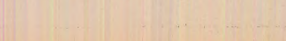
CARNET CINEMATOGRAFIC „Campionii”