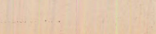
CARNET CINEMATOGRAFIC „Campionii”