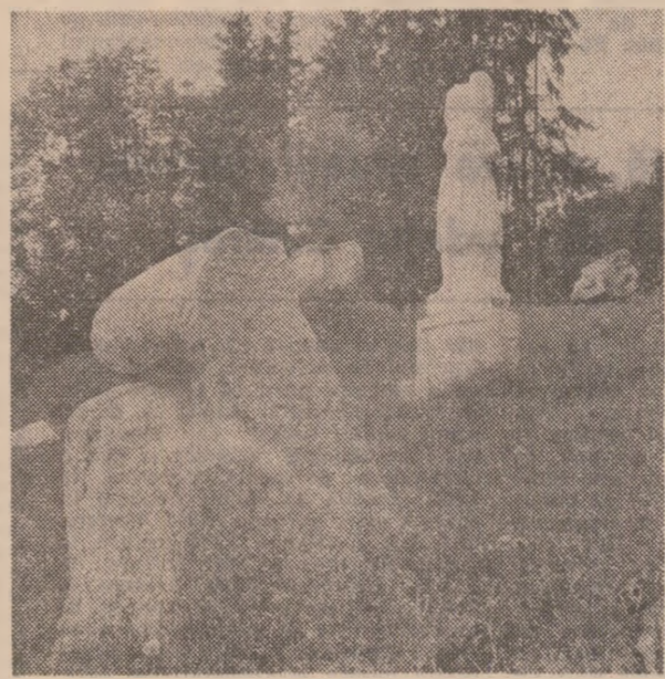
Vedere din tabără