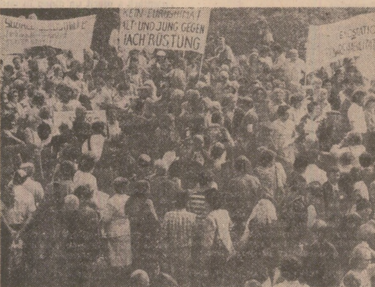
Demonstrație la Hamburg (R.F.G.) împotriva cursei înarmării, pentru convertirea cheltuielilor militare în alocajii destinate sectoarelor sociale. Participanții au manifestat sub deviza: „Tineri și bătrâni împotriva sporirii arsenalului militar!”

PARIS 19 (Agerpres). — Aproximativ trei mii de persoane au participat la Paris la o demonstrație de protest împotriva deciziei Administrației americane privind fabricarea bombelor cu neutroni, în formă de demonstrație la Paris. Participanții purtau pancarte pe care se putea citi: „Nu dorim o Euroshima!”, „Nu dorim o Euroshima!”, „O delegație a participanților la demonstrație a remis Ambasadei S.U.A. din capitala franceză un mare număr de petiții în care se exprima protestul ferm împotriva deciziei americane.