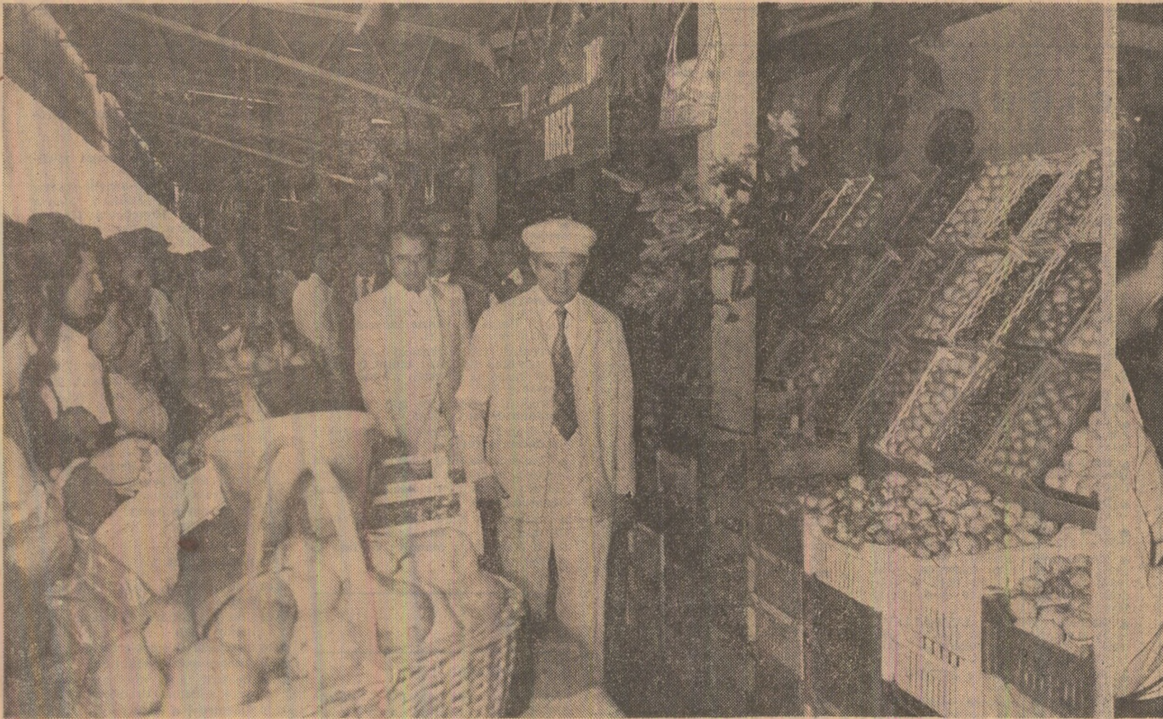
În piața Ober — unul din cele mai mari vaduri comerciale ale Capitalei

Întreaga desfășurare a vizitei a fost marcată de frumoase și emoționante manifestări ale dragostei, prețurii și recunoștinței pe care cetățenii Bucureștilui, ai patriei noastre le poartă celui mai iubit fu al poporului nostru, tovarășul Nicolae Ceaușescu, a cărui viață și activitate reprezintă o minunată pîidă de slujire cu dezvoltare și înaltă pasiune revoluționară a intereselor poporului nostru, a cauzei păcii și socialismului în întreaga lume, fiecare moment al acestei întîlniri cu secretarul general al partidului prilejuind reafirmarea hotărîrii tuturor celor ce muncesc de a înlăturarea indicățiile sale, politica, Programul partidului de înflorire continuă a patriei noastre socialiste.