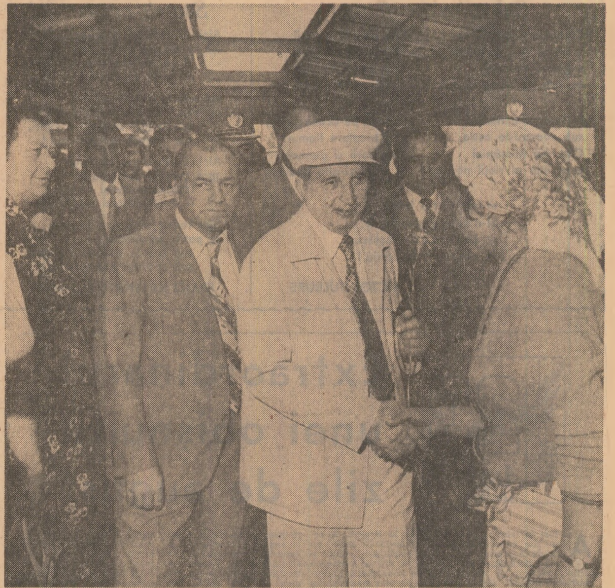
În piața Berceni-Sud