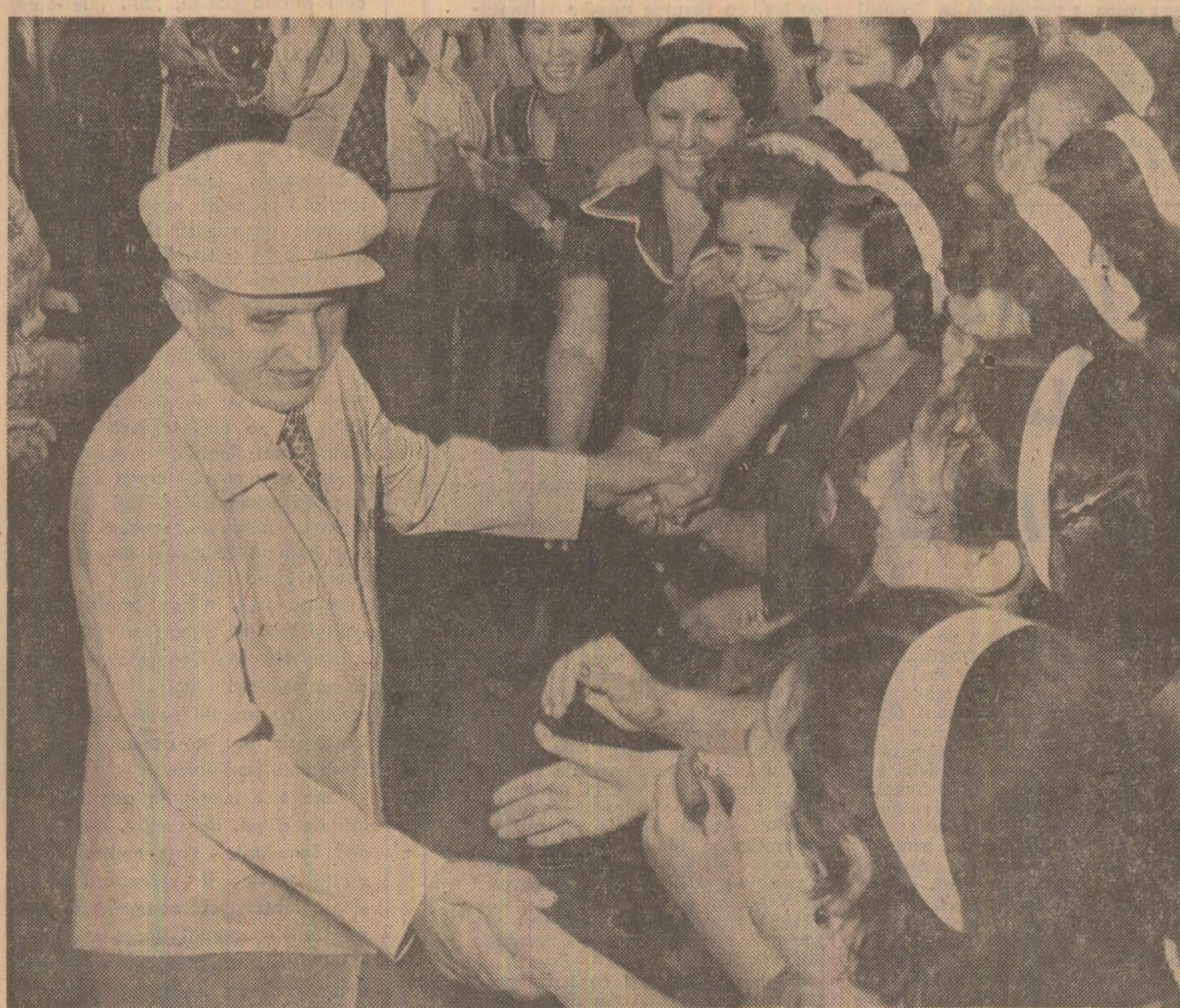
La Întreprinderea de confecții și tricoteje: urări din inimă, adresate secretarului general al partidului