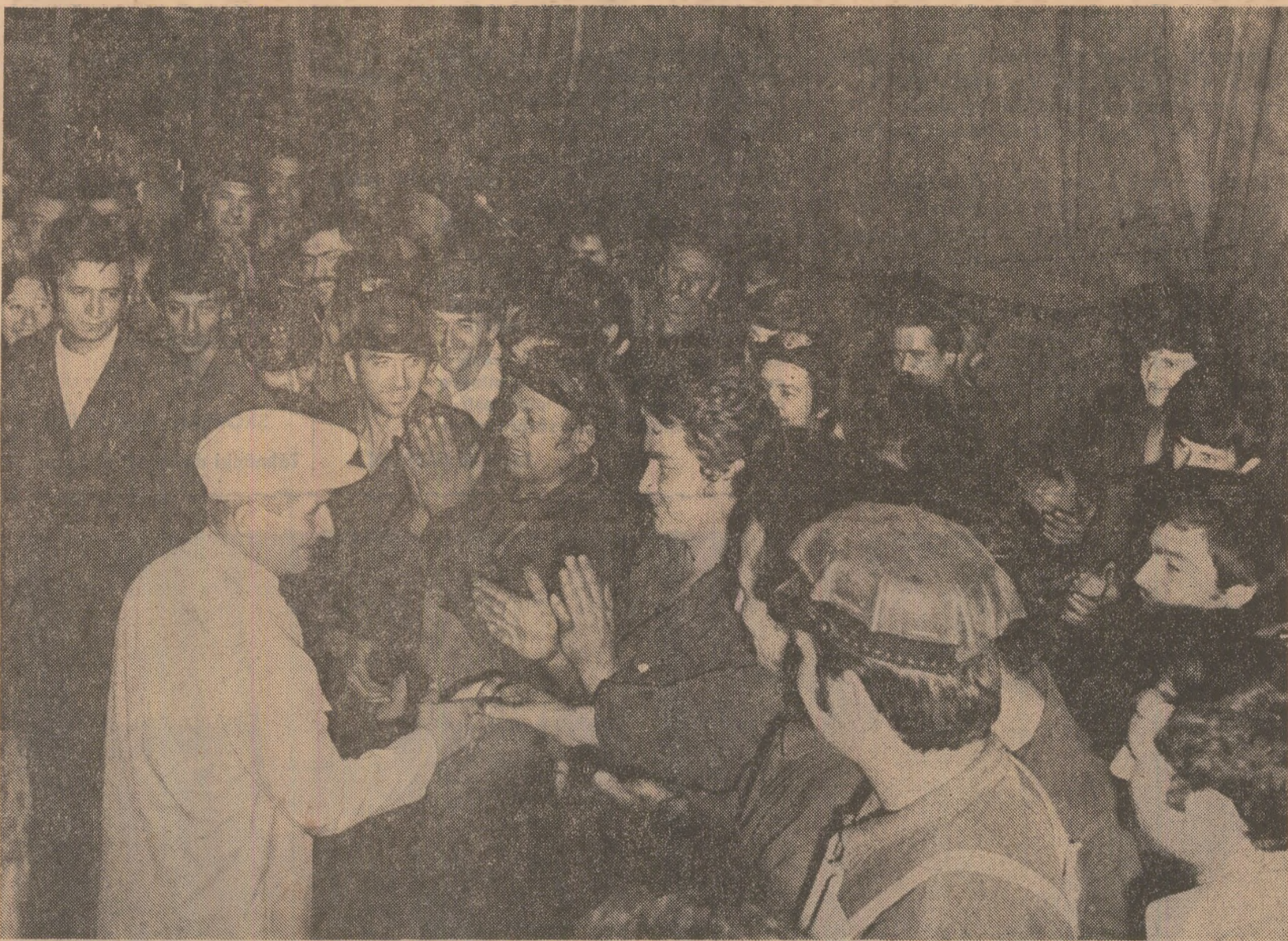
În mijlocul colectivului muncitoresc de la „Grivița roșie”