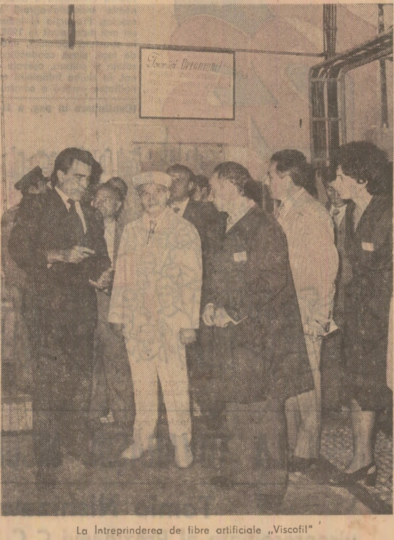
La întreprinderea de fibre artificiale „Viscofil”

În hala pietei, unde expun deosebi unitățile de stat, secretarul general al partidului se interesează de cantitățile de produse puse în vânzare și solicită părerea gospodinelor referitor la aprovizionare. Se fac propuneri de a se asigura o mai bună ritmicitate în aprovizionarea acestor pieti — cea mai mare din Capitală — cu întreaga gamă sortimentală agroculturărilor și alte staturii din piață, secretarul general al partidului a cerut extinderea suprafețelor de vânzare, folosirea mai rațională a spațiilor. Tovarășul Nicolae Ceaușescu a indicat comitetului municipal de partid să mențină o legislație permanentă cu unitățile producătoare care aprovizionează pietele Capitalei, în vederea unei reparti-