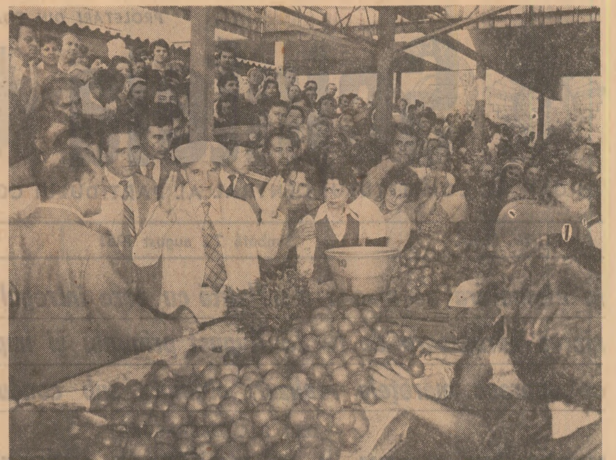
Căldă primire făcută de locuitorii cartierului Titan

La sosirea tovarășului Nicolae Ceaușescu, cei din conducerea partidului și statului sînt întâmpinați de tovarășii Elena Burescu, ministrul industriei ușoare, Elena Nae, prim-secretar al Comitetului de partid al sectorului 8, Elena Burescu, directorul întreprinderii, Elena Verona Burtă, președintele consiliului oamenilor muncii, Gherghina Ionescu, președinta comitetului sindicalului, și alte cadre de conducere din unitate, de numeroase muncitoare, care acalmă îndelung pentru partid și secretarului său general, exprîndu-și bucuria și satisfacția pentru această nouă întâlnire cu tovarășul Nicolae Ceaușescu.