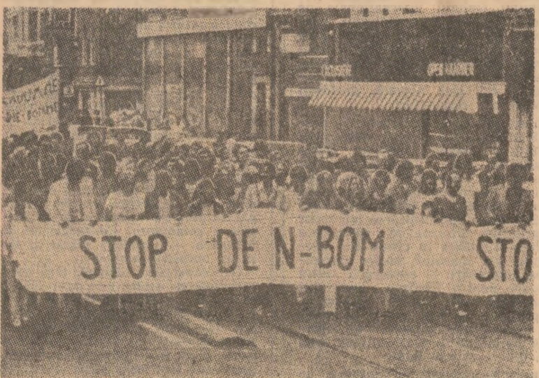
Demonstrație a militanților pentru pace la Amsterdam (Olanda)

● În cuvântarea rostită la deschiderea lucrărilor celei de-a XXXI-a Conferințe Pugwash, prof. W. Epstein, președintele Comitetului Pugwash din Canada, s-a pronunțat în favoarea opririi cursei înarmărilor și creării unei atmosfere de încredere între statele Lăcrărilor Conferinței Pugwash, la care iau parte 200 de oameni de știință din 50 de țări ale lumii, se desfășoară în localitatea canadiană Banff. Participanții la reuniune, a cărei temă este „Calea către pace într-o lume de criză”, examinează, timp de șase zile, problemele fundamentale ale vieții internaționale actuale, în primul rând cele legate de reducerea înarmării, promovarea desistării, realizarea dezarmării, întărirea păcii și securității în Europa și în întreaga lume.