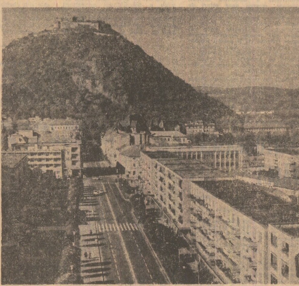
Străvechea cetate a Devei — matoră a unor transformări înnoitoare.