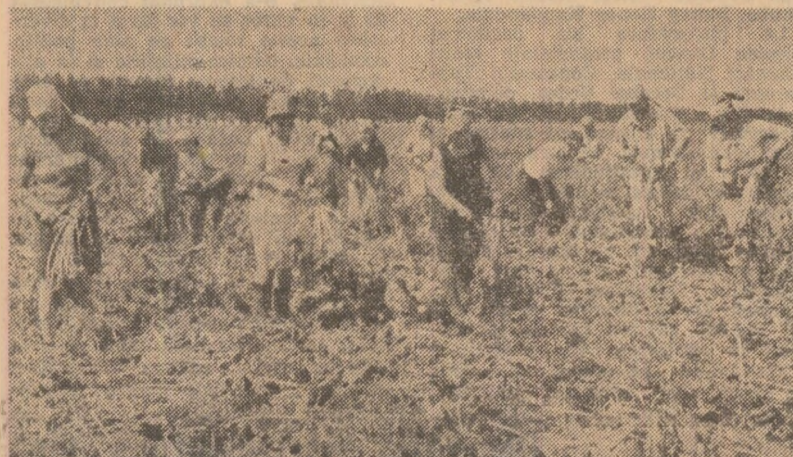
La recoltarea sfeclii de zahăr pe terenurile cooperativei agricole de producție Smeeni, județul Buzău.

scop, consiliile populare, comunale, orașenești, județene, tîndu-se stama de atribuțiile pe care le au în conducerea activității agricole, au datorită realizarea producțiilor mari prevăzute a se obține în 1982. În lumina sarcinilor formulate de tovarășul Nicolae Ceaușescu, la toate culturile trebuie să se muncească în formații mari, specializate, lichidîndu-se cu desăvîrșire depozitarea în cîmp, pe teren general al partidului, să lucreăm oarecum nu după vorbe și rețecate, ci după producțiile pe care le-au realizat și să punem oameni pasionați, pricepuți, hotărîți să asigure înfăptuirea programului de dezvoltare a agriculturii. Un singur problemă importantă de care depinde dezvoltarea producției agricole, dealtfel subliniate în repetate rînduri de conducerea partidului, de secretarul său general, trebuie să-și găsească mai rapid rezolvarea. Aceasta se referă, așa cum sublinia tovarășul Nicolae Ceaușescu, la înfăptuirea mai rapidă, mai hotărîți a programului de mecanizare completă a agriculturii. Trebuie să ne înfăptuim la mașinilor agricole aprobate, crearea unor soiuri de înaltă productivitate și eliminarea cu desăvîrșire a practicilor de a folosi semente și sămînțe de calitate inferioară la patra, la crearea unor soiuri noi și pentru cereale, pentru plante tehnice, cit și pentru legume etc. Într-un cuvînt, este necesar să se treacă mai hotărîți la creșterea activității de cercetare, de creare a noi soiuri, de ceea ce cere practica producției agricole.