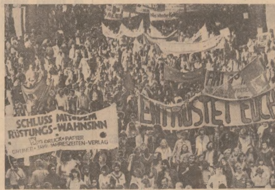
La Hamburg a avut loc o mare manifestație pentru pace și dezarmare. Împotriva producerii și perfecționării armelor nucleare, inclusiv a bombeii cu neutroni, demonstrația la care au participat circa 20.000 de persoane. Pe pancartele purtate de manifestații era scris: „Să se pună capăt cursei iraționale a înarmărilor!”