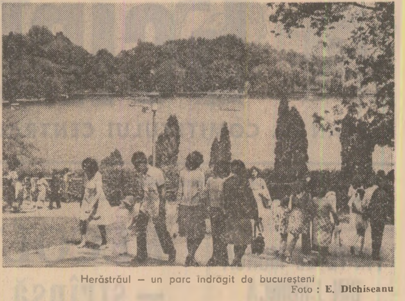
Herăstrăul — un parc îndrăgit de bucureșteni.