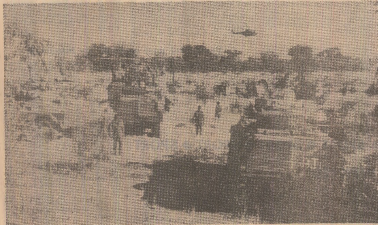
Fotografia de mai sus, reproducută din ziarul francez „Humanité”, înfățișează unități blindate ale rasiștilor sud-africani în timpul incursiunii pe teritoriul Angolei. Dealtfel, un purtător de cuvînt militar sud-african, citat de agențiile France Presse, Reuter și United Press International, a admis că unitățile militare ale regimului de la Pretoria se află încă în Angola, înfrîmînd astfel toate declarațiile anterioare cu caracter diploomatic de oficialități rasiste, care încercaseră să inducă în eroare opinia publică internațională, pretinzînd că s-ar fi retras.