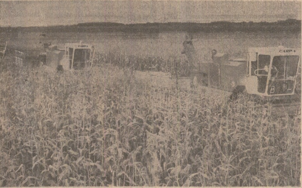
În numeroase unități agricole din județul Giurgiu a început recoltarea porumbului. În fotografie: pe terenurile I.A.S. Giurgiu

În cadrul acumulării de apă ce se amenajează la Rogojesti au început, cu două luni mai devreme, lucrările de construcție la cea de-a doua microhidrocentrală amplasată pe riul Siret, în zona județului Botoșani. Ea va avea o putere instalată de 3,8 megawați. Începerea mai devreme a construcției a fost posibilă ca urmare a adoptării de către constructori și neavutului de materiale pentru construirea versanților acumulării, soluții care vor contribui, în plus, la obținerea unor economii de 750 tone ciment și 6000 litri carburanți.