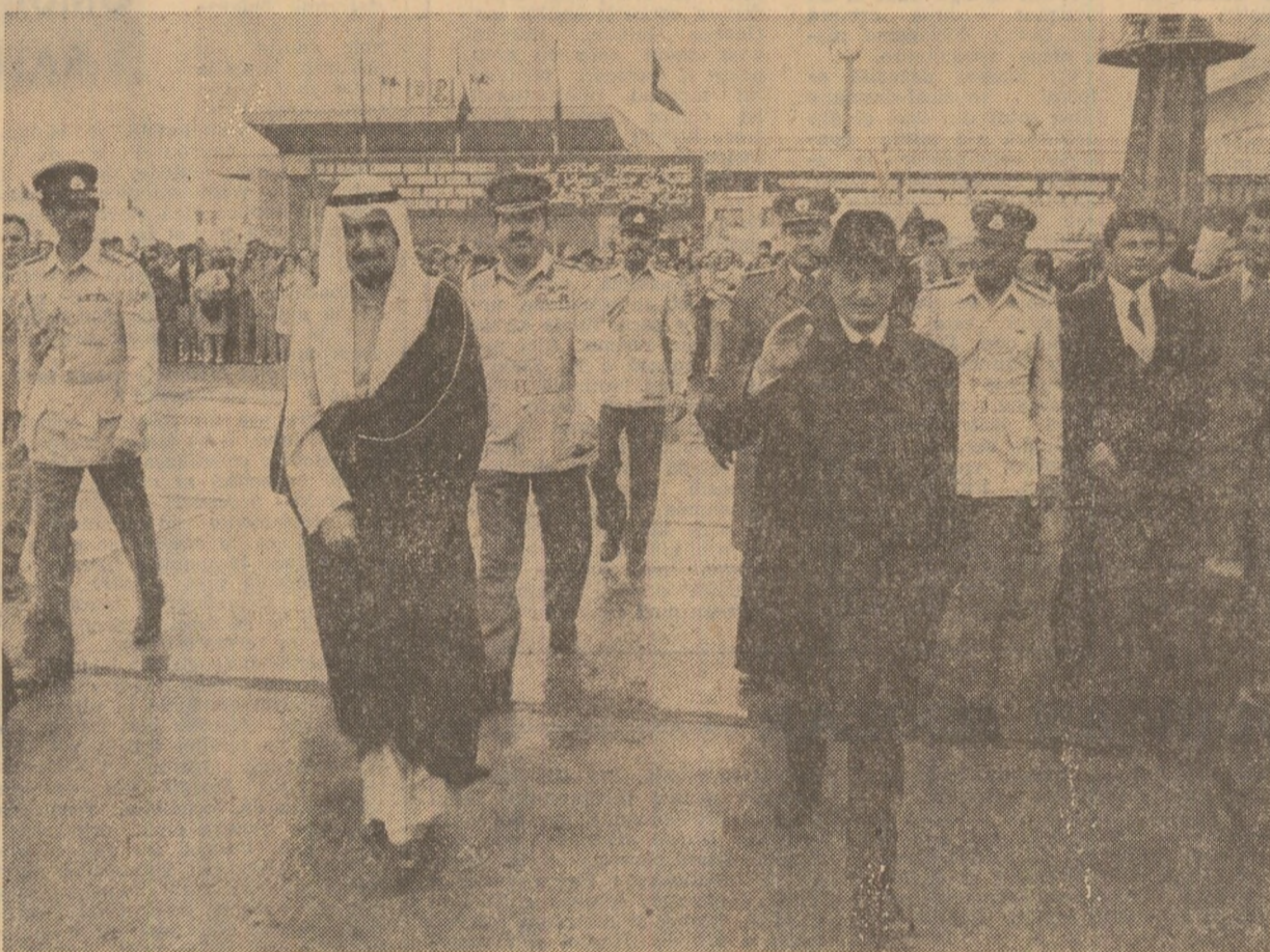
Imagini de pe aeroportul Otopeni