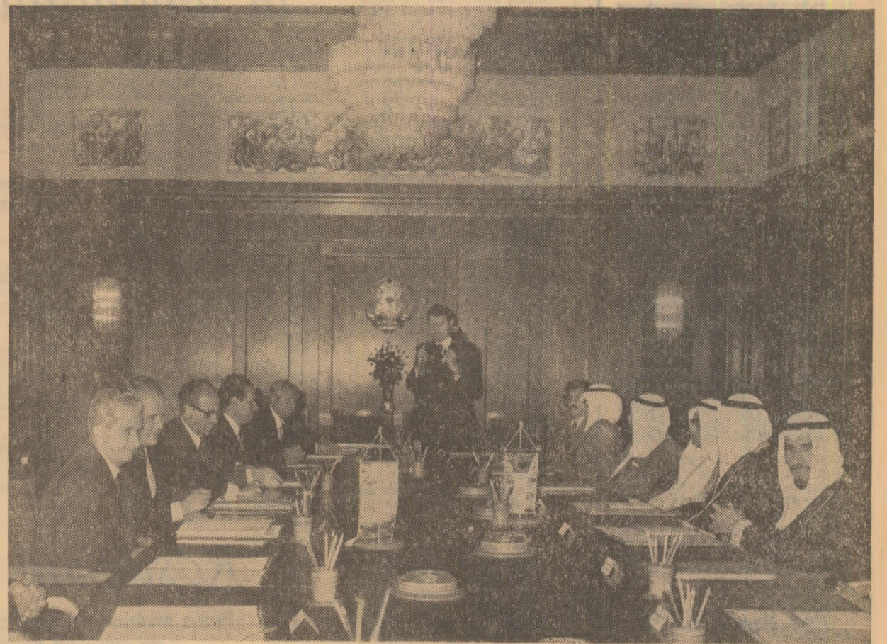
Aspect de la convorbirile oficiale