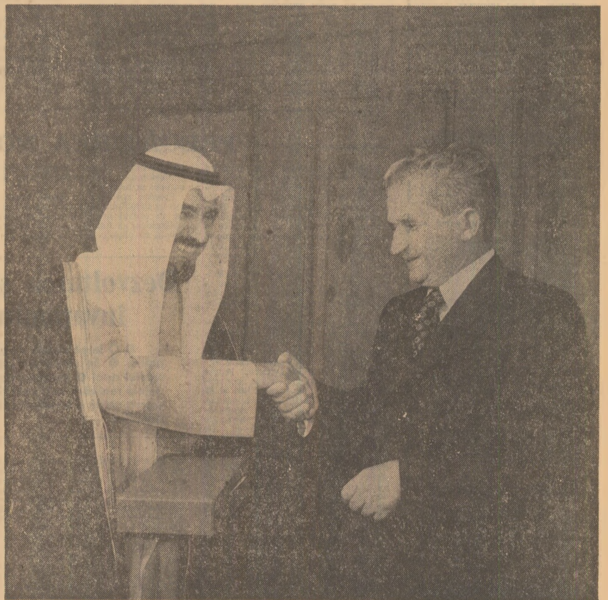
La înmănarea înaltei distincții

Mulțumind cu deosebită căldură președintelui Nicolae Ceaușescu pentru înalta distincție, Alteța Sa secul Jaber Al-Ahmad Al-Jaber Al-Sabah a arătat, la rândul său, că apreciază această ca și simbol al relațiilor prietenești care există și se dezvoltă între Kuwait și România.