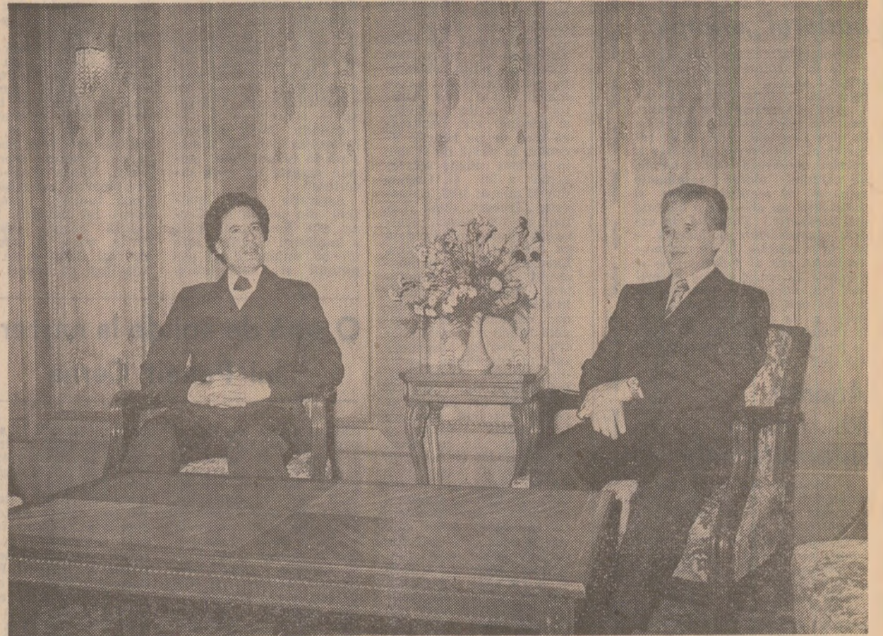
În timpul vizitei protocolare