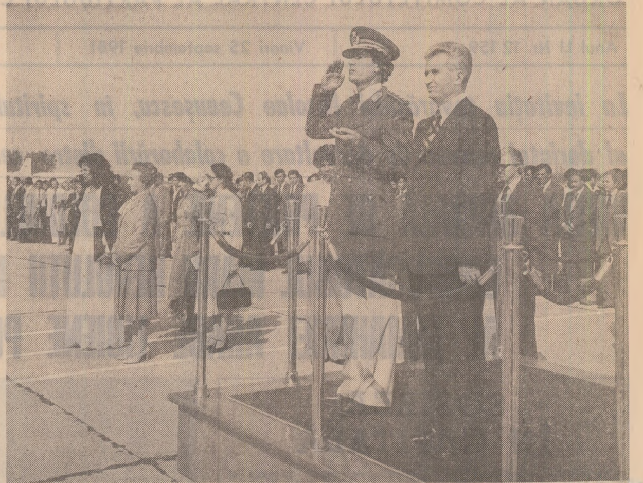
La sosire, pe aeroportul Otopeni