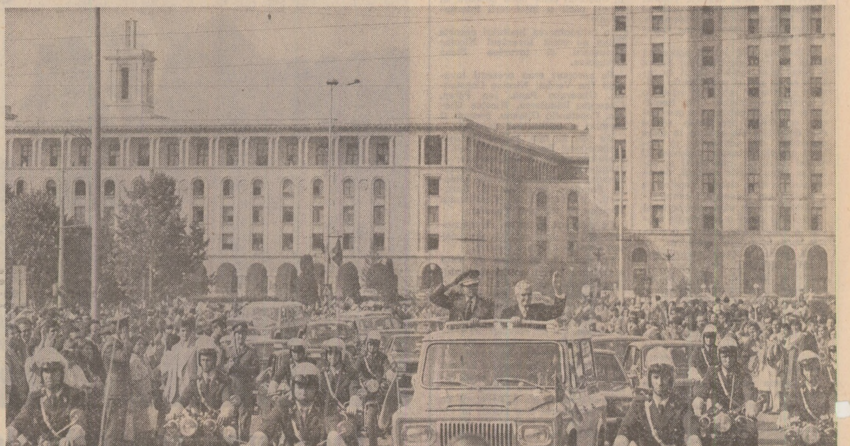
Înălți oșpeți sint salutați cu deosebită căldură de mii de bucurășteni veniți în întâmpinare

losul dezvoltării economiilor României și Libiei, al cauzei păcii și înțelegerii internaționale. În cadrul convorbirilor s-a subliniat, în același timp, existența unor vaste posibilități de aprofundare și extindere a conlucrării reciproce avansate dintre cele două țări, stabilindu-se domenii și sectoarele în care urmează să se acționeze pentru dezvoltarea colaborării româno-libiene. În acest sens, președintele Nicolae Ceaușescu și colonelul Moammer El Gaddafi au însărcinat pe ministrul de resort să examineze căile concrete de adâncire a colaborării și cooperării româno-libiene în ramurile economice de bază, inclusiv în direcția cooperării în producția industrială și agricolă, a realizării în comun a unor obiective economico-sociale de interes reciproc. De ambele părți s-a exprimat dorința de a imprima conlucrării româno-libiene un dinamism mai puternic, în conformitate cu posibilitățile pe care le oferă economiile celor două țări, aflate în plină dezvoltare, cu aspirațiile de progres și bunăstare ale popoarelor noastre. Convorbirile oficiale româno-libiene la nivel înalt se desfășoară într-o atmosferă de caldă prietenie.