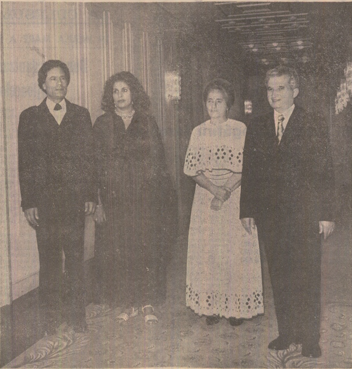
Înainte dîneului oficial

În timpul dîneului, care s-a desfășurat într-o atmosferă caldă, prietenească, președintele Republicii Socialiste România, tovarășul Nicolae Ceaușescu, și conducătorul Marii Revoluții de la 1 Septembrie, colonelul Moammer El Gaddafi, au rostit toasturi. Urmărite cu interes și subliniate cu aplauze, toasturile au fost marcate în mod solemn, la terminarea lor, de imnurile de stat ale Jamahiriei Arabe Libiene Populare Socialiste și Republicii Socialiste România.