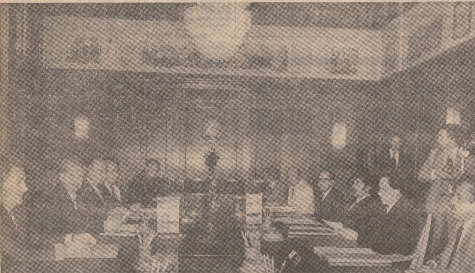
In timpul convorbirilor oficiale