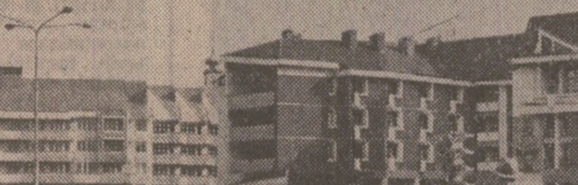
Noul centru civic al oraşului Bistriţa

— Cum se explică această normalizare? — În loc de orice altă explicaţie vă voi relata situaţia din familia mea. Sîntem patru — doi copii, soţia şi eu. În ultimele două luni am cumpărat cîte 6 kg de zahăr. Deci în total 12 kg. N-am consumat însă decît 4. Ştiînd că