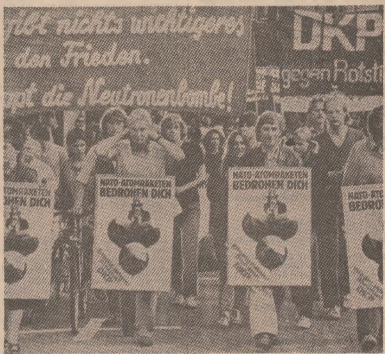
„Nu există nimic mai important decât pacea. Stop bombe cu neutroni! „Vrem să trăim în pace, fără bombe atomice americane!”, Sub aceste lozinci au demonstrat tinerii militanți pentru pace în orașul vest-german Hamburg