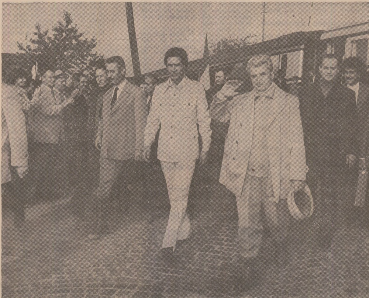
La sosirea în județul Harghita

În timpul vizitei în județul Harghita, cei doi conducători au fost