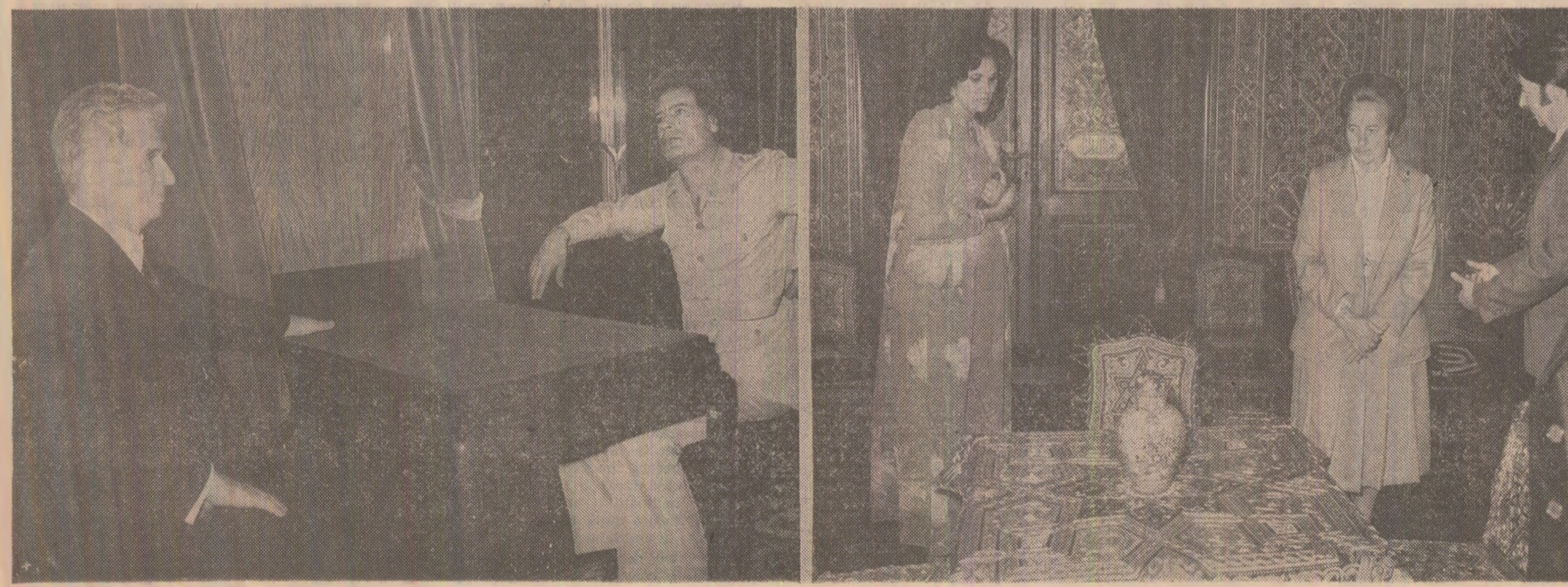
Dialog fructuos, în spiritul relațiilor de prietenie

ROMAN VLAD, compozitor, muzicolog, directorul Operei „Cotanzani” din Roma: „Nimeni nu se mai îndoaie că „Oedip” este o capodoperă și că trebuie să existe în repertoriul marilor scene lirice. Mă voi întoarce în Italia și mă voi strădui ca „Oedip” să strălucească sub lumina rampelor pe scena lirică din Roma. Este impresionant faptul că din ce în ce mai mulți cercetători se apleacă asupra creației acestui mare muzician român. Un simpozion am ascultat analize pline de adevărate, reali- (Continuare în pag. a IV-a)