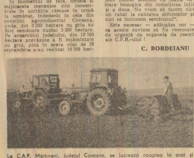
Le C.A.P. Mărtinești, județul Covasna, se lucrează noaptea la arat și pregătirea terenului, iar ziua la semănat