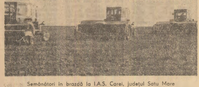
Semănători în brazdă la I.A.S. Carei, județul Satu Mare