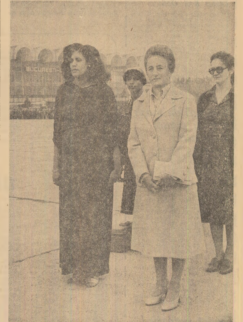
Aspecte de la ceremonia plecării de pe aeroportul internațional Otopeni