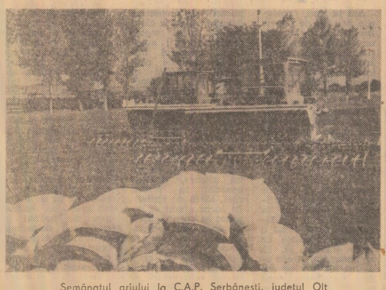
Semănatul grâului la C.A.P. Șerbănești, județul Olt.

Gheorghe BALTA correspondentul „Scintei”