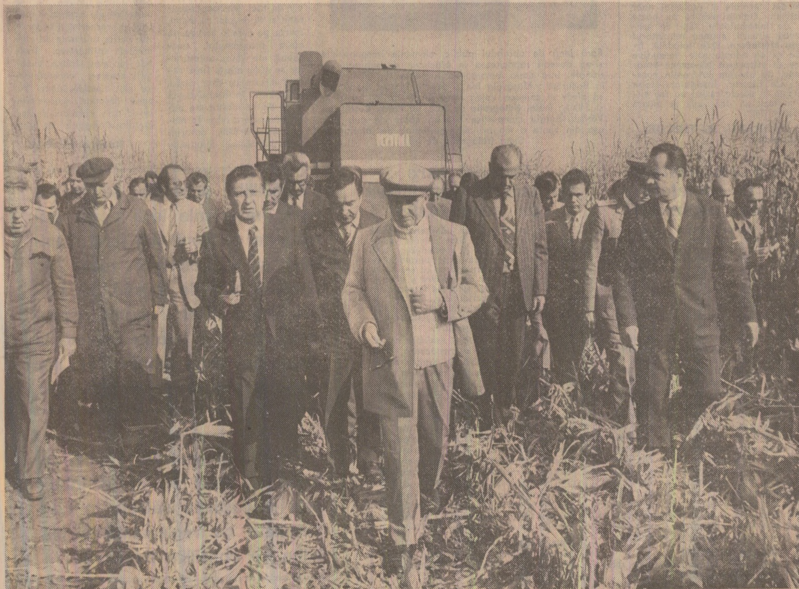
Pe terenurile din perimetrul întreprinderii agricole de stat Dragalina