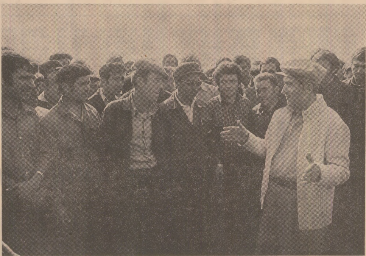
În mijlocul oamenilor muncii de la Stațiunea experimentală pentru culturi irigate Mărculești

pentru folosirea ei și în legumicultură și pe suprafețele ocupate de planșe de talie înaltă. A fost urmărită la lucru, în continuare, instalația de aspersiune cu pivot central, care poate realiza în 11 zile irigarea unei suprafețe de 53 de hectare. Noua instalație poate fi folosită pentru toate culturile, indiferent de talia acestora.