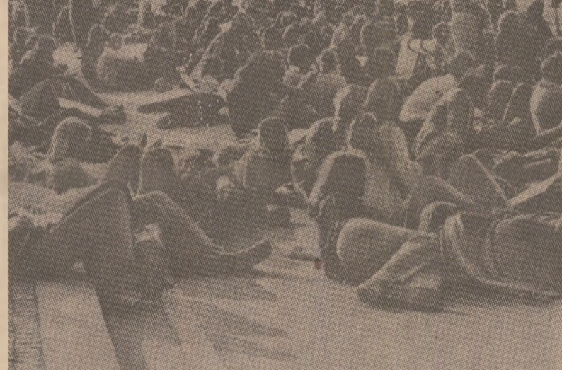
În țările Europei occidentale, mișcarea împotriva proiectelor de escaladare a cursei înarmărilor nucleare cuprinde mase tot mai largi și a forme tot mai variate. În fotografie: într-o piață a orașului vest-german Stuttgart, o mare mulțime de tineri s-a așezat pe caldarîm, în semn de protest împotriva hotărîrii privind producerea și stocarea bombeii cu neutroni

60.000 arme nucleare, depășind ca forță explozivă echivalentul a 50 de miliarde tone trinitrotoluen, ceea ce face să planșeze un imens pericol asupra însăși existenței omenirii. Războiul nu se poate împăca nici cu uriașa risipă de resurse provocată de înarmări, multii miliarde de dolari în fiecare an, care depășesc de departe pragul de o mie de miliarde dolari!