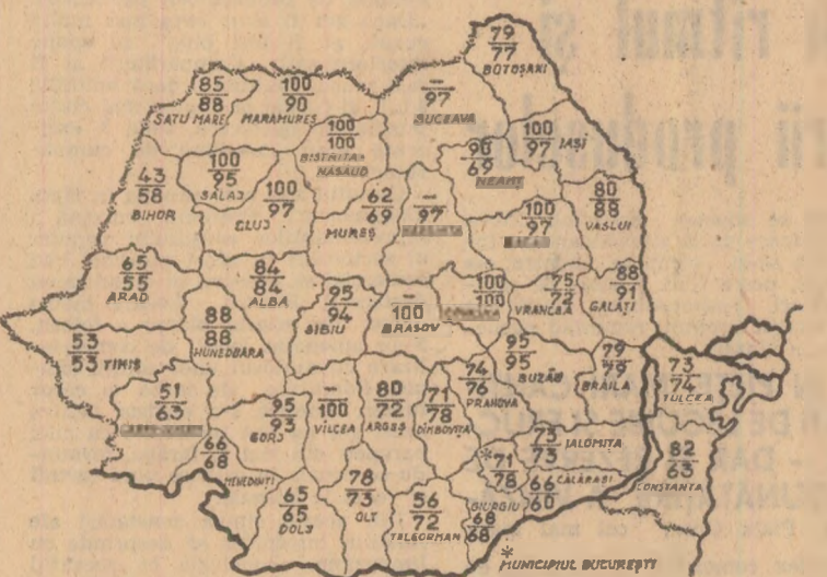
STADIUL ÎNSĂMÎNȚĂRII GRÎULUI LA 12 OCTOMBRIE. Cifrele înscrise pe hartă reprezintă, în procente, suprafețele semănate în intraprederile agricole de stat (cifra de sus) și în cooperativele agricole (cifra de jos)

După cum rezultă din datele centralizate la Ministerul Agriculturii, la 12 octombrie mai erau de semănat cu grîu 540 000 hectare. Este o suprafață mare dacă ținem seama că pînă la sfîrșitul epocii optime au mai rămas doar 9 zile. Sînt cîteva județe — Mureș, Botoșani, Neamț, Caraș-Severin — unde semănatul este mult rămas în urmă, deși această lucrare trebuia încheiată la 12 octombrie. Totodată, și în unele județe de cîmpie, mări cultivate, cum sînt Timiș, Dolj, Teleorman, Constanța, Călărași, Arad, Bihor și Giurgiu, unde termenul limită este 15 octombrie, există încă mari suprafețe ce trebuie însămînțate cu grîu. Această stare de lucruri necesită măsuri deosebite ca în multe unități agricole semănatul nu s-a desfășurat în ritm corespunzător, în pofida timpului favorabil din ultima perioadă. Evident, în toate aceste județe, rămînerile în urmă pot influența negativ nivelul recoltei din anul viitor, știindu-se că