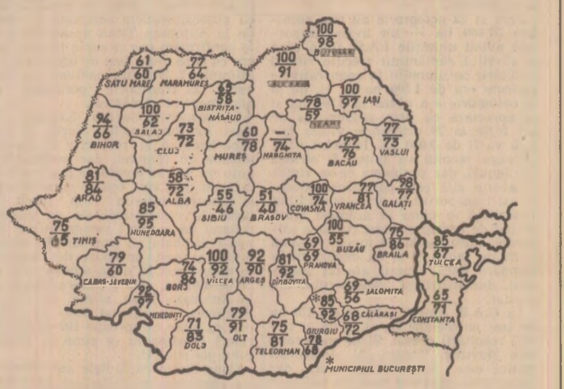
STADIUL RECOLTĂRII PORUMBULUI LA 22 OCTOMBRIE. Cifrele înscrise pe hartă reprezintă, în procente, suprafețele de pe care s-a strins recolta în întreprinderile agricole de stat (cifra de sus) și în cooperativele agricole (cifra de jos).

Recoltarea porumbului este principala lucrare ce se execută acum pe ogoarele țării... (text continues)