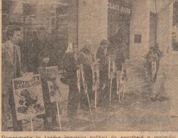
Demonstrație la Londra împotriva politicii de apartheid a regimului racist din Africa de Sud