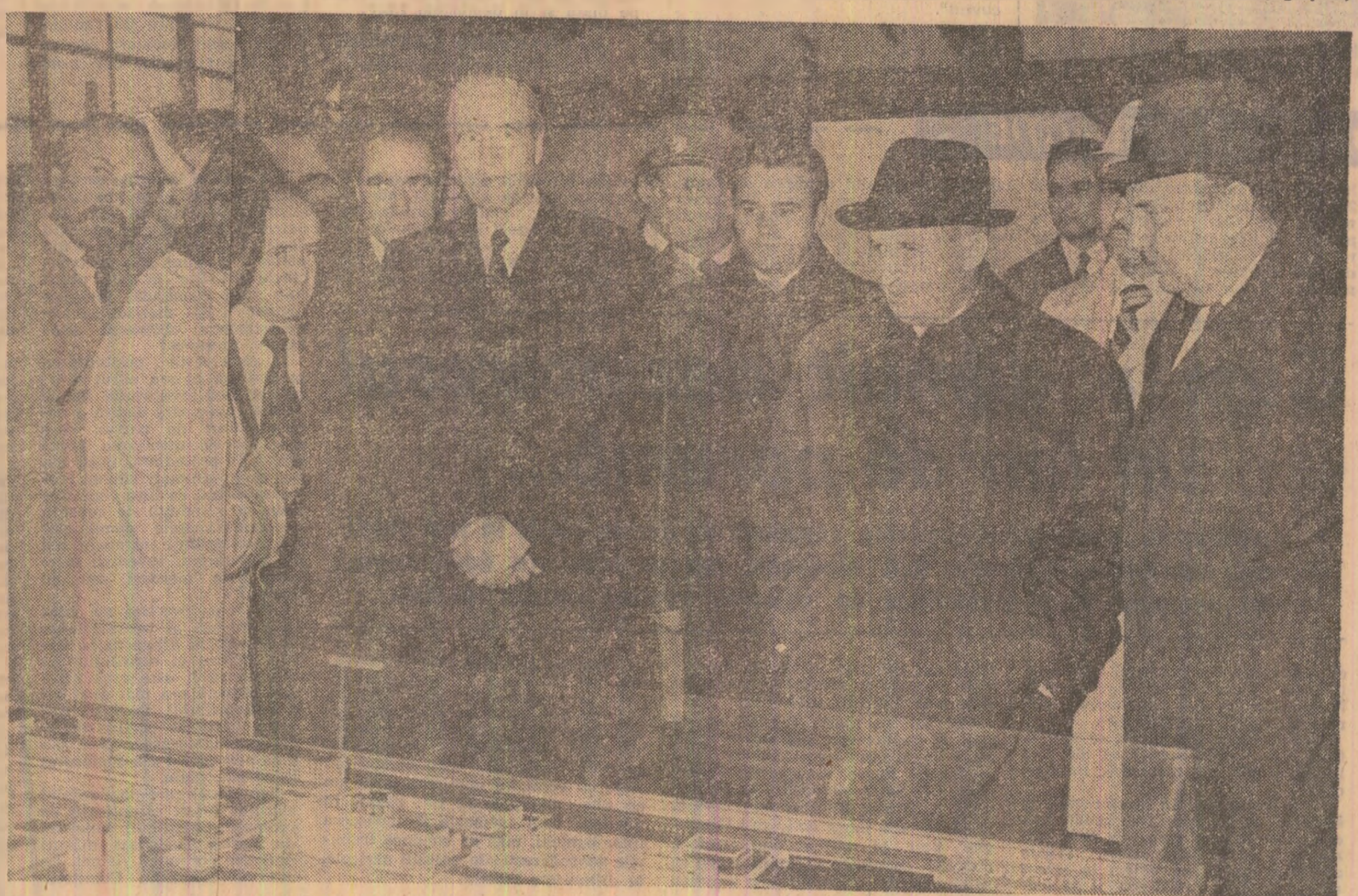
La întreprinderea de mașini grele din București

noscuit o permanentă dezvoltare prin spiritul direct al conducătorului nostru personal a ptelui Nicolae Ceaușescu, fiind păne realizarea unor utilaje, eozente și instalații de o mare citate tehnică destinate industriei mecanice, metalurgice, chimice ori elerelor de construcții. Printre formantele cele mai însemnate colectivelor de aici se numoduc: (Continuare în pag. a II)