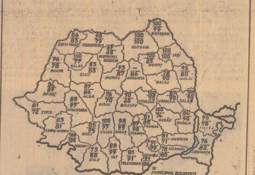
STADIUL RECOLTĂRII PORUMBULUI LA 27 OCTOMBRIE. Cifrele înscrise pe hartă reprezintă, în procente, suprafețele de pe care s-a strins recolta în întreprinderile agricole de stat (citra de sus) și în cooperativele agricole (citra de jos).

ceea ce dovedește că în unitățile agricole din multe județe transportul produselor nu s-a făcut în ritm cu recoltarea. Astfel, decalajul între cantitățile de porumb recoltate și cele transportate a crescut la circa 580 000 tone. Mari cantități de porumb continuă să se afle pe cîmp, indeosebi în cooperativele agricole din județele Călărași — 63 000 tone, Constanța — 55 000 tone, Bălța — 23 000 tone, Giurgiu — 15 000 tone, Ialomița — 15 000 tone, Tulcea — 7 000 tone. De asemenea, există pe cîmp, în grămezi, multă sîcică de zahăr, indeosebi în cooperativele agricole din județele Olț, Arad, Satu Mare, Vaslui, Neamț, Botoșani, Cluj, Mureș și altele. Decalajele care au fost create între recoltare și transport sînt determinate, în principiu, de faptul că autovehiculele și tractoarele cu remorci nu sînt folosite la capacitatea maximă, fac un număr redus de curse, adesea pe distanțe scurte. Este nevoie de o intervenție energică a comandamentelor județene pentru agricultură în vederea dirijării cu operativitate a mijloacelor de transport în acele unități în care se află pe cîmp cantități mai mari de produse. Totodată, se impune ca în fiecare întreprindere agricolă de stat și cooperativă agricolă să se asigure suficienți oameni la încărcare, iar la bazele de recepție preluarea produselor să se facă operativ, astfel încît în cel mai scurt timp întreaga recoltă din cîmp să ajungă la locurile de depozitare.