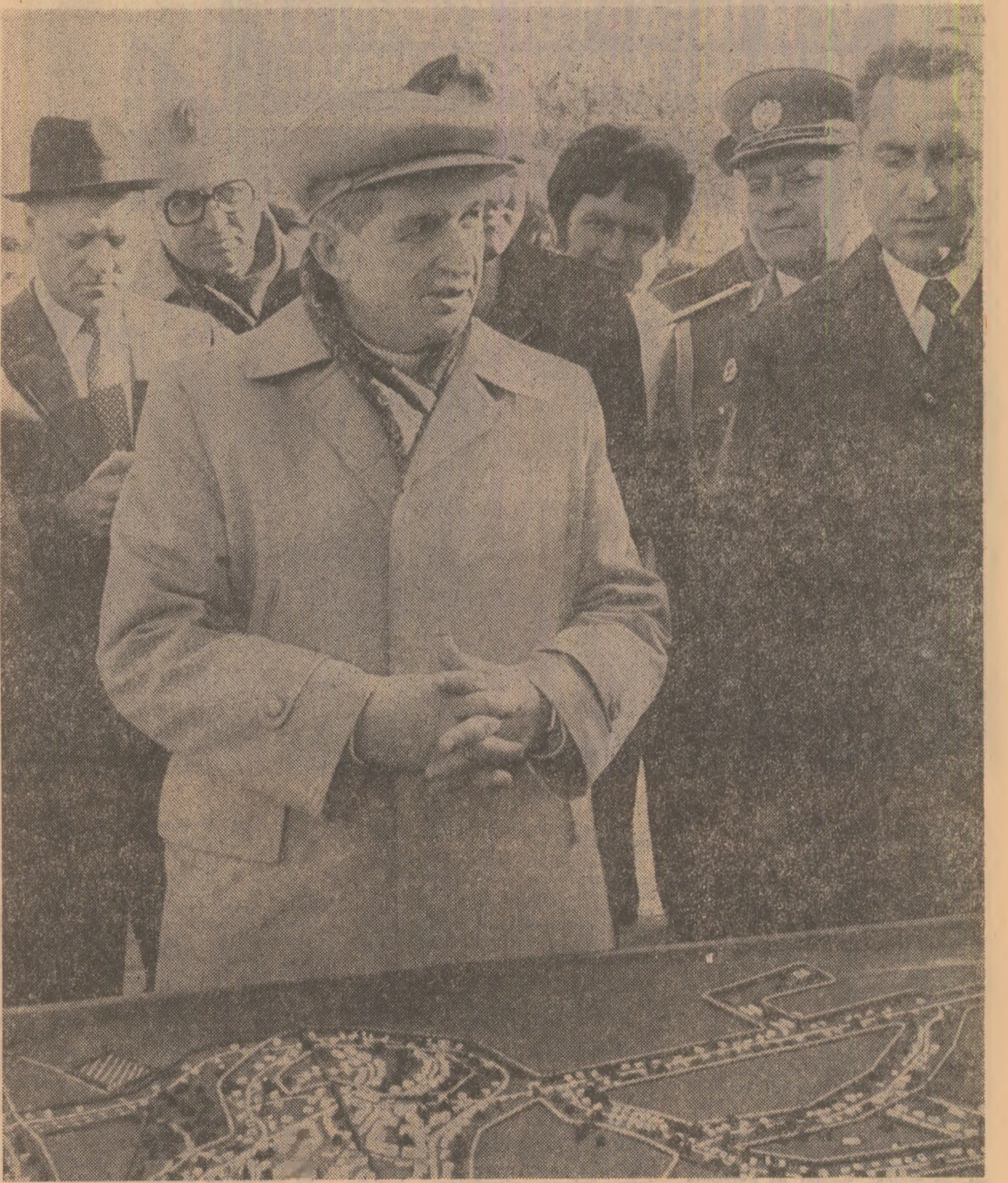
La Livada, așezare a cărei dezvoltare economică, dotările social-culturale prefigurează viitorul centru agroindustrial