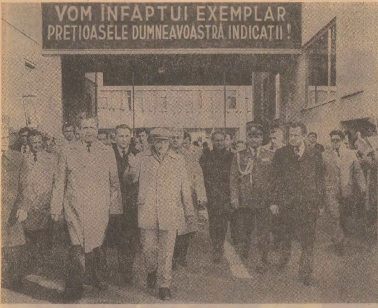
VOM ÎNFAPTUI EXEMPLAR PREȚIOASELE DUMNEAVOASTRĂ INDICATII