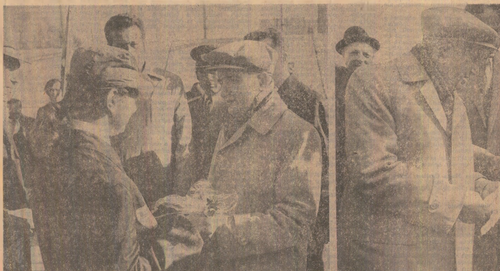
Floii ale recunoștinței pentru profundele transformări economico-sociale pe care le-a cunoscut în ultimii ani Țara Oașului