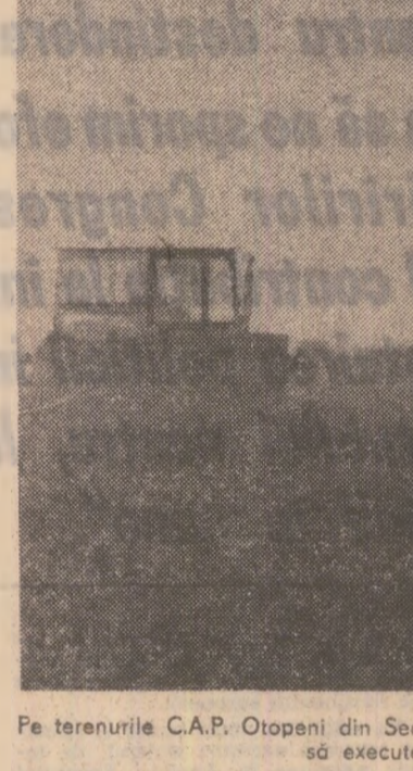
Pe terenurile C.A.P. Otopani din Sectorul agricol Ilfov, mecanizatorii de C.A.P. execută arături adînci