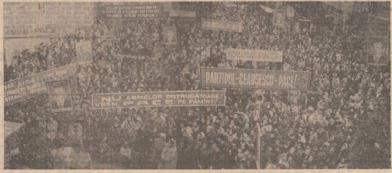
Aspect de la adunarea oamenilor muncii, consacrată dezarmării și păcii, desfășurată la Întreprinderea „Clujana” din Cluj-Napoca. Într-o atmosferă însufletită, de puternică angajare cetățenească.

GLASUL CELOR CU TIMPLELE CARUNTE Cei mai vîrstnici dintre noi, Știm de bombe și ruine, Știm ce-nseamnă un război, Prețul vieții-știm prea bine. Azi spre zări de viitor Ni-s privirile-ndreptate — Tot ce-avem, tot ce durăm Din iubire-s înălțate. GLASUL NOII GENERAȚII Noi, cei tineri, ne-am născut Sub lumini de nouă țară, Temerarii noștri azi Spre înalte culmi urcăr; Azi spre zări de viitor Ni-s privirile-ndreptate — Tot ce-avem, tot ce durăm Din iubire-s înălțate. GLASUL PUIILOR DE OM Zîmbet de copil gingaș Cheamă-n case bucuria — Ne jucăm și creștem mari Și ni-i scumpă România! Azi spre zări de viitor Ni-s privirile-ndreptate — Tot ce-avem, tot ce vedem Din iubire-s înălțate. GLASUL VRERII UNANIME Dragostea în suflet cold ecou strănește, Tandără șuvoire, necuprins avînt — Crească-n libertate florile visării Și să fie pace, pace pe pămînt! Aștig dor de viață, gînd senin de pace Stăruie în inimi, treamă din cînt — Vrerea noastră este munca să rodescă Și să fie pace, pace pe pămînt! CORNELIU ȘERBAN