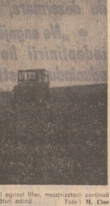
Pe terenurile C.A.P. Otopani din Sectorul agricol Ilfov, mecanizatorii de C.A.P. execută arături adînci