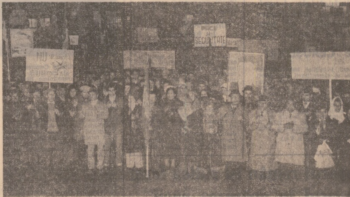
În timpul mitingului pentru pace care a avut loc la Întreprinderea de utilaj de transport din București

O lozincă domină sala: „Strîns uniți în jurul Partidului Comunist Român, în cadrul Frontului Democratice și Unității Socialiste, să acționăm neobosit pentru triumful păcii, colaborării și prieteniei între toate popoarele lumii!“ La miting participă sute de oameni — muncitori, ingineri, maeștri, economiști. Cu toții sînt constructori. Locul lor de muncă: Grupul de sanitarie construcții-montaj nr. 7 din Capitală. Atmosfera este înaltă. Se scandează: „CEAUȘESCU — PACE!“