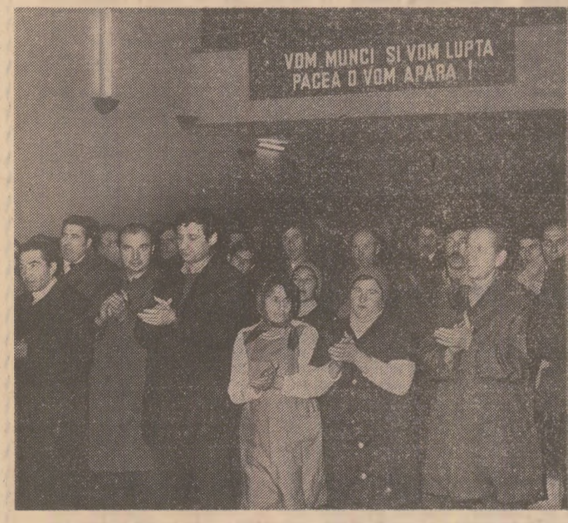
În timpul mitingului pentru pace — la Întreprinderea bucureștenă „Loromet”

În pagina a 2-a: RELATĂRI DE LA ADUNĂRI ȘI MITINGURI În pagina a 3-a: TELEGRAME ADRESATE C.C. AL P.C.R., TOVARĂȘULUI NICOLAE CEAUȘESCU