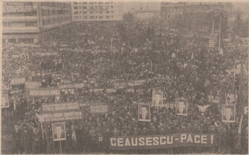
Aspect de la marea adunare publică desfășurată ieri la Tîrgoviște

Cei care au luat cuvîntul au dat glas gin-