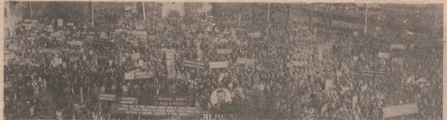
Ieri, la Ploiești, în timpul impresionantelor adunări publice

În încheierea acestor impresionante manifestații, participanții au adoptat, într-o deplină unitate de voință și simțire, motțiuni adresate Comitetului Central al Partidului Comunist Român, tovarășului Nicolae Ceaușescu, prin care se reafirmă totala adevine la noua inițiativă de pace a conducerii României socialiste, la întreaga politică internă și externă a partidului și statului nostru, hotărîrea lor nestrămutată de a se opune războiului, de a milita pentru instaurarea unui climat de pace și securitate care să asigure dezvoltarea pașnică, liberă, nestîngherită a fiecărui popor, împlinirea aspirațiilor de progres și bunăstare ale întregii omeniri.