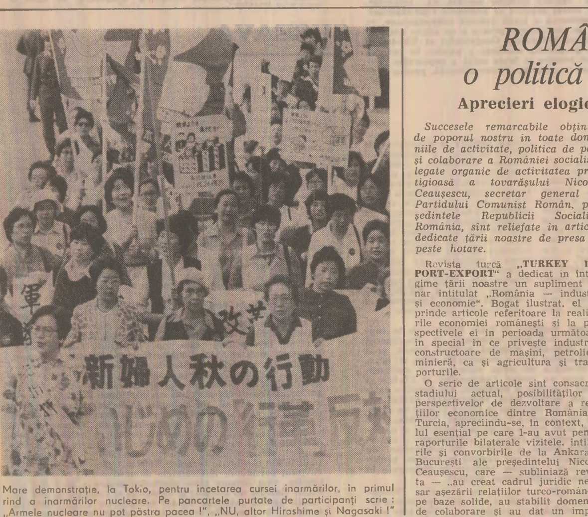
More demonastrare, la Tokio, pentru încetarea cursei înarmărilor, în primul rînd a înarmărilor nucleare. Pe pancartele purtate de participanți scrie: „Armele nucleare nu pot păstra pacea”, „NU, altor Hiroshime și Nagasaki!”