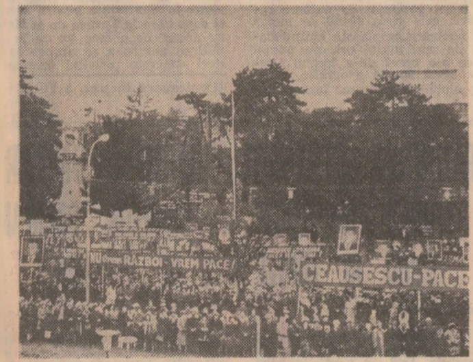
Imagine de la marea adunare populară din municipiul Brăila