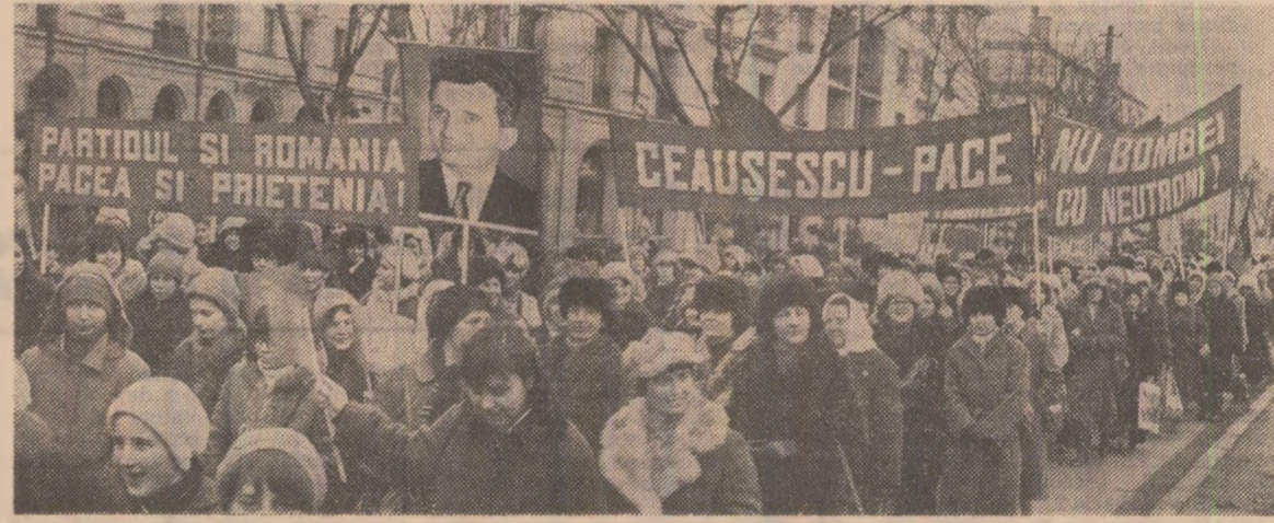
Prin mii de glasuri, femeile din sectorul 1 al Capitalei și-au exprimat, ieri, în cadrul unui impresionant marș al păcii, adevăratele voințe și năzuințe de pace a tovarășului Nicolae Ceaușescu, hotărîrea lor fermă de a acționa în spiritul pretindevărilor, liniștea căminelor de primădie unui nou război

zlușea față de hotărîrea adoptată de Marea Adunare Națională de a împuternici pe tovarășul Nicolae Ceaușescu să se adreseze conducătorilor Uniunii Sovietice și Statelor Unite ale Americii, celorlalți șefi ai statelor semnatare ale Actului final de la Helsinki în vederea opririi amplasării de noi rachete cu rază medie de acțiune în Europa și retragerii celor existente, pentru ca popoarele de pe continentul nostru să poată trăi fără teama că vor deveni victime ale armelor nucleare, să-și poată concentra eforturile creatoare în vederea înfloririi și continuării a străvechii lor civilizații. În luările de cuvînt, în telegrammele adresate C.C. al P.C.R., tovarășului Nicolae Ceaușescu s-a subliniat, totodată, voința femeilor din Capitală de a acționa în spiritul apelurilor Marii Adunări Naționale, Frontului Democratice și Unității Socialiste, Consiliului Național al Oamenilor Muncii, ale celorlalte organizații și organisme reprezentative din țara noastră