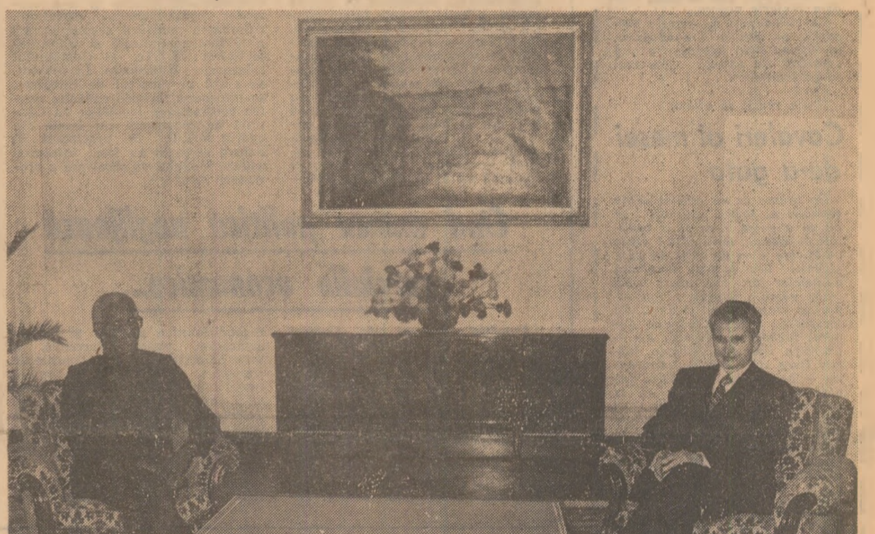
Președintele Republicii Socialiste România, tovarășul Nicolae Ceaușescu, a primit, vineri, pe Hugh Desmond Hoyte, vicepreședinte al Republicii Cooperatiste Guyana, coordonator al activității economice planificării și finanțelor, care, în