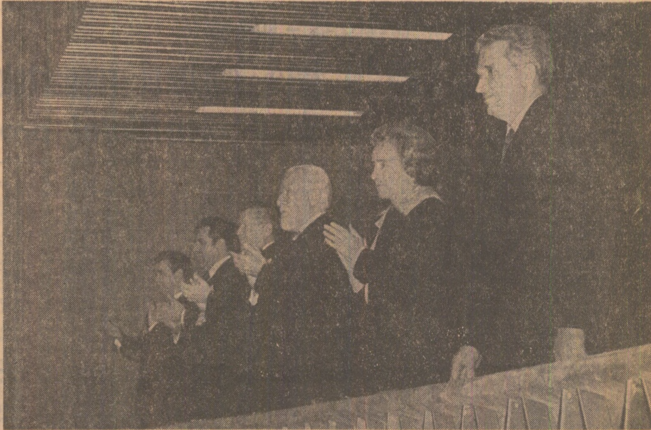
La spectacolul de gală al laureaților Festivalului „Cîntarea României”