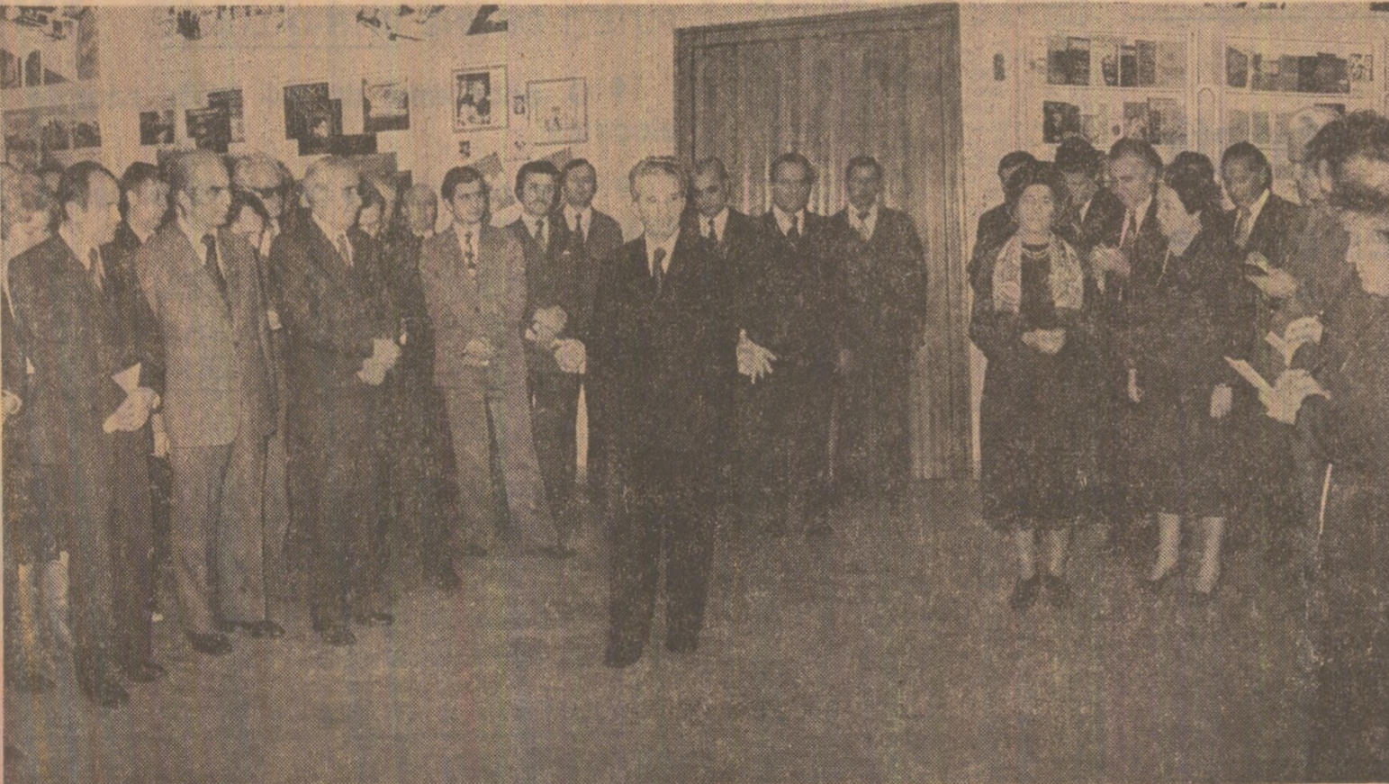
Se subliniază necesitatea angajării mai puternice, militante, a creației artistice