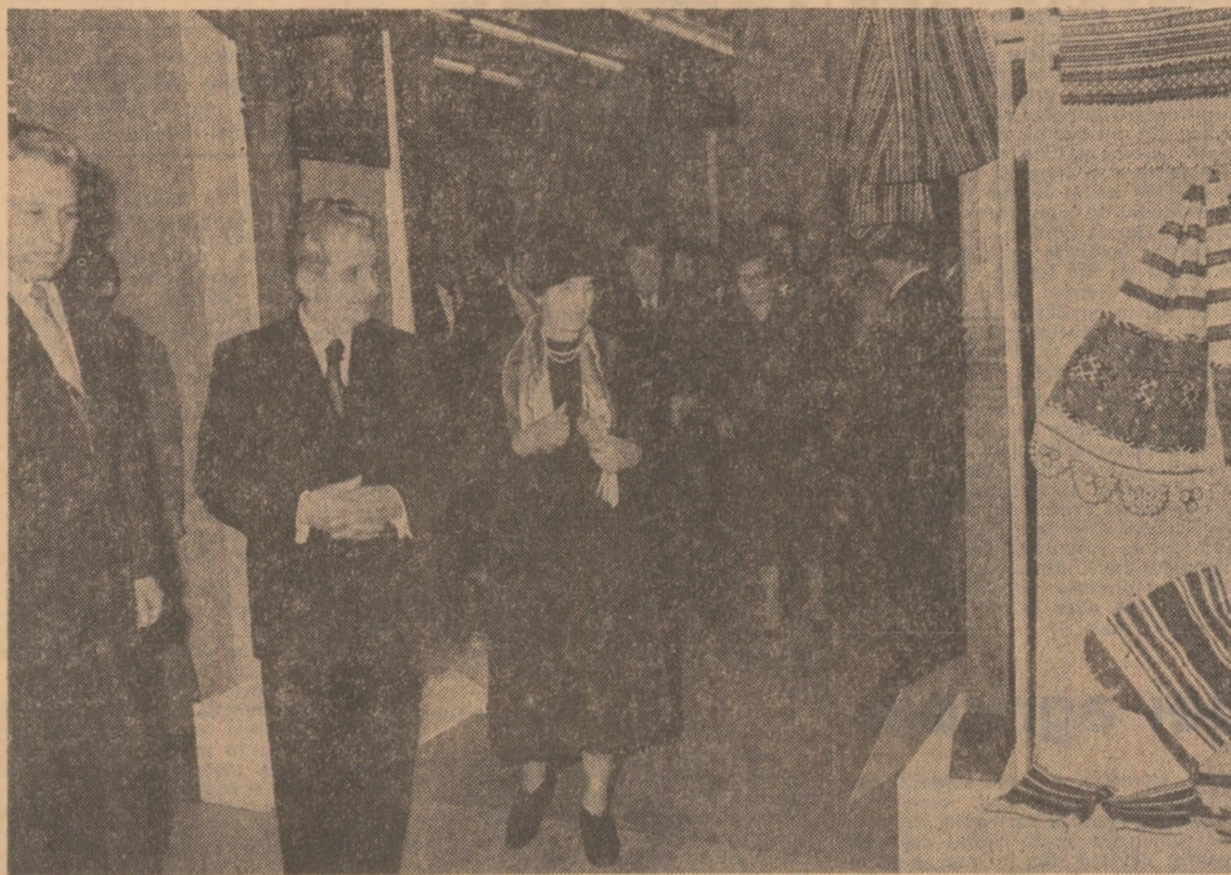
Moment din timpul vizitării expoziției

VIZITA LA EXPOZIȚIA REPUBLICANĂ A CREATORILOR POPULARI, ARTIȘTILOR AMATORI ȘI PROFESIONIȘTI laureați ai Festivalului „Cîntarea României” 1979-1981