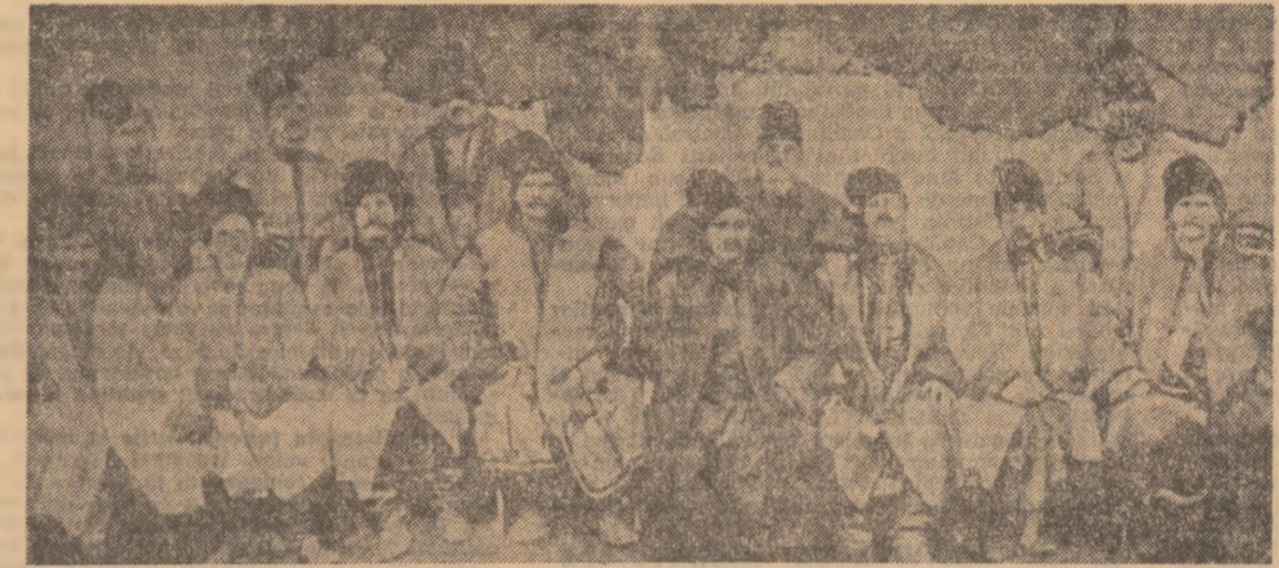
Deputații fruntași din Adunarea ad-hoc a Moldovei

Eludarea deciziei Convenției de la Paris prin dubla alegere a lui Alexandru Ioan Cuza, mai întîi ca domn al Moldovei, apoi ca domn al Munteniei, le-a apărut ca singura cale de a realiza a multor voinți uniri. Factorul decisiv al acestei duble alegeri au fost masele populare. În jurul cădării Adunării electivă, de la București, multimea, după descrierea unui marilor ocular, „o mare vie ale cărei valuri abia se puteau mișca și care amenința să năvălească pe usi și pe ferestre în Camera și să-și sufie drepturile și principiul său”. Cînd dubla alegere a devenit o realitate, această mare se care își așese și îndepînise unirea mare istoric, a dat curs liber imenselor bucurii a tuturor împlinite: „Nu se mai auzeau în toată Capitala — informația ziarului „Românul” — decât cele două cuvînturi: „unirea și bucurie! Să trăiască Cuza! Să trăiască viitorul nostru stăpînitor! zbură din gură în gură, din inimă în inimă, îmbrățișările cele mai