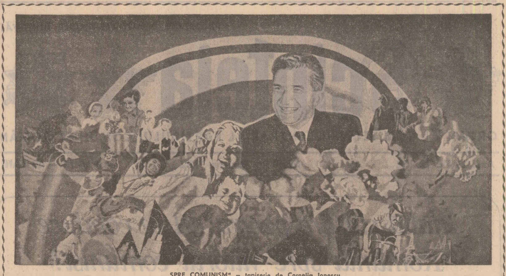
„SPRE COMUNISM” — tapiseria de Cornelia Ionescu

tuale a poporului român. Izvorul bucuriei noastre vine tocmai din adevăratele noastre la această luptă pentru mai bine, iar mai binele, mai frumosul, mai adevăratul și mai înălțatul vis al omenirii sînt inseparabile de activitatea creatoare a oamenilor, a popoarelor, de acele sîmendori în care se încrustează conștiința valorii noastre ca popor. Pentru condițiile ce ni se creează în sensul celor arătate mai sus, multumim tovarășului Nicolae Ceaușescu, secretar general al partidului nostru, iar cu prilejul aniversării zilei sale de naștere îl urăm un călduros „La mulți ani!”