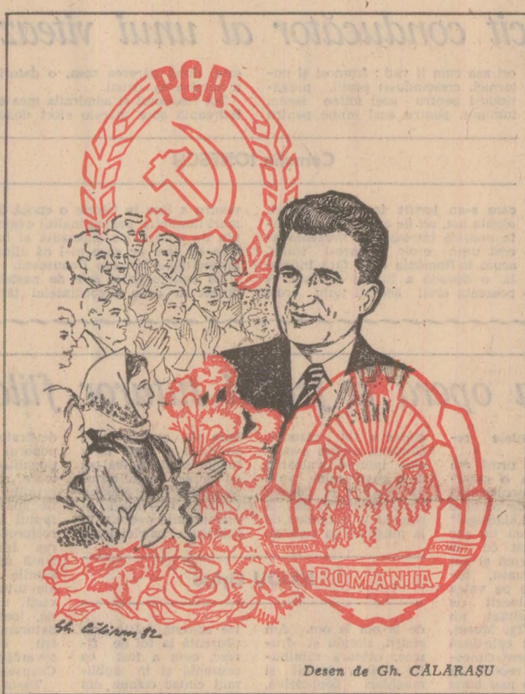
Desen de Gh. CĂLĂRASU

În persoana secretarului general al partidului, a președintelui republicii, poporul român omagiază pe revoluționarul comunist a cărui viață reprezintă o pildă strălucită de dăruire, de angajare devotată în slujba idealurilor poporului, a cauzei socialismului. Pe cel care, având mereu aproape de inimă vreștii și nădejdele poporului său, s-a înrolat din fragedă tinerețe în lupta pentru triumful acestor idealuri, sub roșile flamuri ale partidului comunist, adîndu-se de multe decenii mereu în primele rânduri ale luptei. Prezența sa ca reprezentant al tineretului în conducerea Comitetului Național Antifascist, solidarizarea curajoasă cu conducătorii eroicilor lupte muncitorești din ianuarie-februarie 1933, implicarea în procesul de la Craiova, rodnică activitate desfășurată pentru unirea și mobilizarea tineretului în lupta împotriva pericolului fascist, contribuția remarcabilă la organizarea marilor demonstrații antifasciste și antirăzboinice de la 1 Mai 1939, muncă neobosită pentru reconstrucția și consolidarea organizatorică a Uniunii Tineretului Comunist, în fruntea căreia avea să fie ales, creionează portretul exemplar al revoluționarului de profesie, care s-a