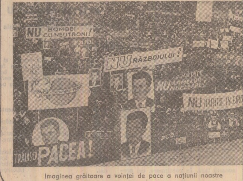
Imaginea grăitoare a voinei de pace a națiunii noastre

Istorică inițiativă de pace a tovarășului Nicolae Ceaușescu s-a bucurat, din primul moment, de cel mai profund ecou în conștiința întregii noastre națiuni socialiste. Ca un singur om, țara întreagă și-a exprimat adesea nețărmurită această inițiativă, pătrunsă de nobilele idei ale umanismului. Ea a dinamizat energiile poporului român, otelindu-i voiața de a milita, alături de celelalte popoare, spre a face să izbândească visul de aur al omenirii de a trăi fără teama de război și distrugere. La numai câteva zile de la prezentarea inițiativei de pace, prezența secretarului general al partidului, președintelui Republicii, în mijlocul oamenilor muncii dintr-un șir de județe ale țării, transformă aceste întâlniri de lucru în impresionante manifestări populare de sprijin unanim față de această generoasă inițiativă. Această atmosferă de puternică eferescență politică domnește în întreaga țară. Deplină și entuziastă adeziune a poporului se manifestă în multiple forme: