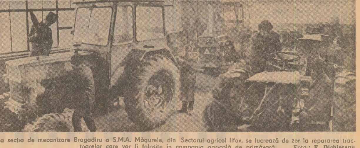
La secția de mecanizare Bragadiru a S.M.A. Măgurele, din Sectorul agricol Ilfov, se lucrează de zor la repararea tractoarelor care vor fi folosite în campania agricolă de primăvară.

— Din discuțiile cu specialiștii rezultă că principalul obstacol în calea asigurării cu succes a culturii intensivă a paiștilor o constituie insuficiența punerea în valoare a terenurilor disponibile, la scară mare, la nivelul fiecărei unități de producție și parcele cadastrale în parte. Din datele apărute în sinteza rezultată ca, practic, nu există terenuri cu paiși pe care să nu se manifeste efectul al cel puțin unui factor limitativ al producției de masă verde: eroziunea solului, alunecări de teren, exces sau deficit de umiditate, înundabilitate, sărăturare, aciditate etc. Pe de altă parte, datorită faptului că peste 74 la suta din fondul pastoral este situat pe pante, numai 18 la suta din totalul paiștilor este amenajată și cultivată fără nici o dificultate. În consecință, necesarul de lucrări amelioratoare trebuie puternic diferențiat pe teritoriu. Tocmai pentru aceasta se im-