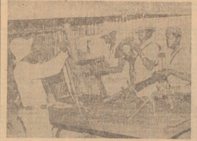
În timp ce Republica Sud-Africană încearcă să-și prelungească dominația asupra Namibiei, torpilind eforturile pentru traducerea în viață a planului O.N.U. privind accesul la independență al acestui teritoriu, patrioții namibieni își intensifică lupta, sub conducerea Organizației Poporului din Africa de Sud-Vest (S.W.A.P.O.), în vederea lichidării ocupației străine, a înfăptuirii aspirațiilor legitime de libertate și independență. În fotografie: o unitate a S.W.A.P.O. în timpul pregătirilor de luptă

Trimisul A.P.P. relevă în continuare că „în cursul vizitei făcute în mai multe sate din Ovamboland, locuitorii au avut numai cuvinte de laudă la adresa S.W.A.P.O. și chiar unii abii n-au ezitat să recunoască marea influență de care se bucură în rîndul localnicilor organizația condusă de Sam Nujoma. Un european, care trăiește în această regiune de mai mulți ani, a mărturisit că „fiecare familie oamho (această etnie numără circa 450.000 persoane, adică aproape jumătate din populația totală a Namibiei) are cel puțin un fiu, un nepot sau un văr în rîndurile S.W.A.P.O.”.