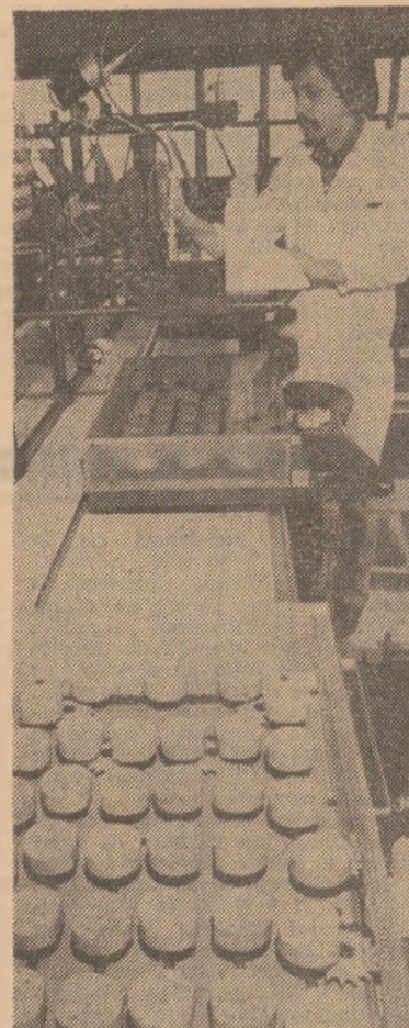
Întreprinderea pentru aparate și utilaje pentru creșterea (IAUC) din Copilețu constituie unul din cele mai elocvente exemple privind concretizarea conceptului de integrare tot mai profundă a învățămîntului cu cercetarea și producția. În imagine: linia automată de montaj pentru ceosuri.