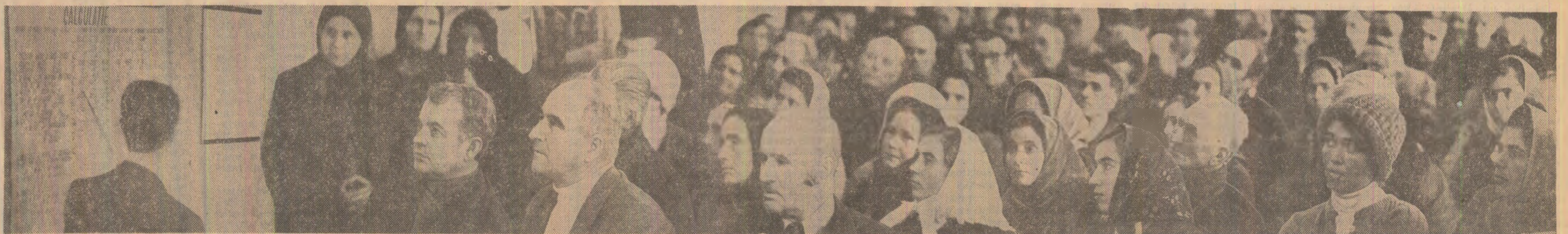
În adunarea generală, cooperativorii de la C.A.P. Braniște, județul Giurgiu, ascultă cu interes demonstrația creșterii veniturilor lor în baza prevederilor din proiectul Legii retribuției muncii în unitățile cooperative. Ei și-au manifestat hotărîrea de a demonstra prin hărnicie că producțiile și veniturile planificate pot fi realizate și depășite

Astăzi la tabla din sala de ședințe, peste puțin timp în cîmp, unde vor prinde viață cifrele din grafice