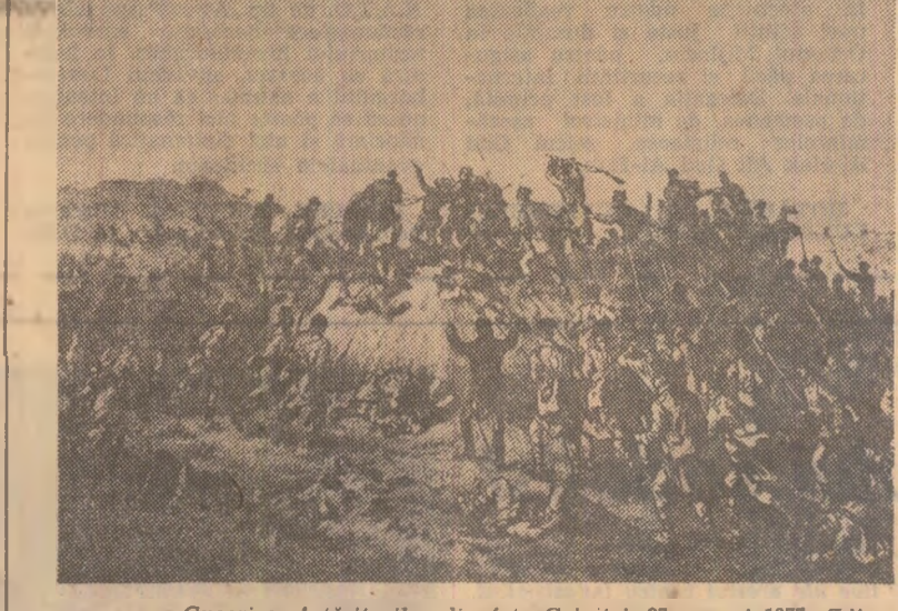
Cucerirea întăriturilor din fața Griviței, 27 august 1877. (Lito-grafie de epocă)

Epopeea războiului de neatințare inscrie la loc de seamă contribuția țărănimii, ai cărei fii au reprezentat 80 la sută din totalul ostașilor aflați pe cîmpul de luptă. Atunci cînd țara i-a chemat, locuitorii satelor au îmbrăcat haina militară, au apucat arma în minile lor muncite și s-au acoperit de nepieritoare glorie la Grivița și Plezna, la Rahova și Smirdan, făcîndu ca din însinguratele redute să se înalte independența și demnitatea României.