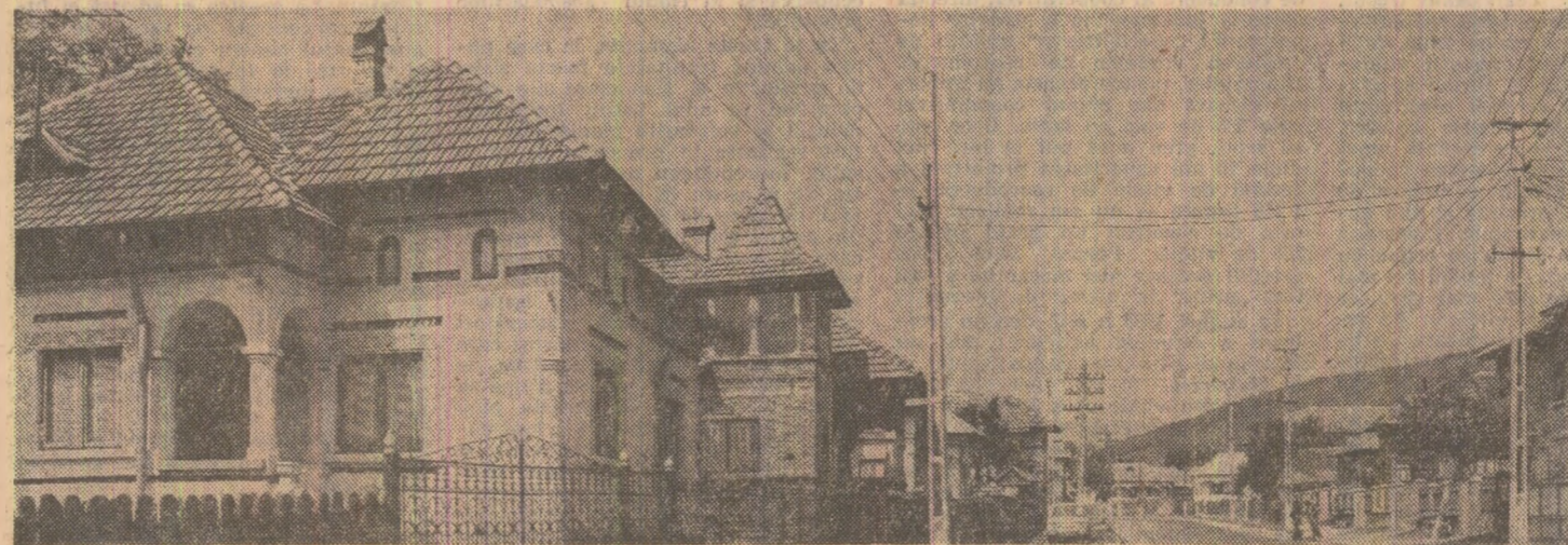
Lerești — Argeș, o comună care și-a schimbat înfățișarea prin hărnicia și spiritul gospodăresc al locuitorilor săi