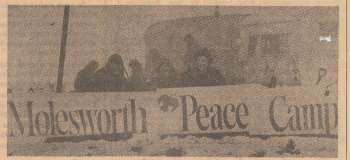
O originală acțiune de protest împotriva amplasării de noi rachete nucleare: la Molesworth (Anglia), un grup de militanți pentru pace a instalat o tabără pe terenul destinat proiectării bazei de rachete

VIENA 18 (Agerpres) — Conceptul unui „război nuclear limitat” este lipsit de sens — a declarat cancelarul federal al Austriei, Bruno Kreisky, la o reuniune a Partidului Socialist din Austria, al cărui președinte este. El a amintit că în climatul internațional actual, caracterizat prin crize economice și poli-