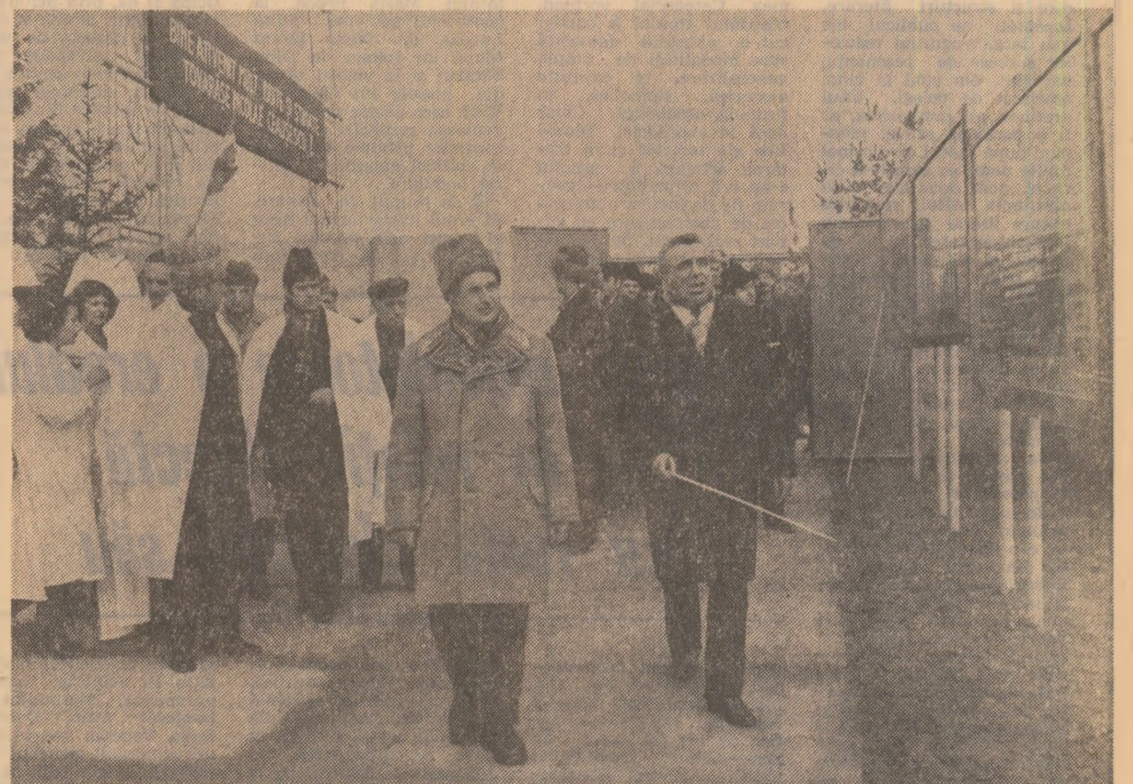
La complexul zootehnic din Pădureni