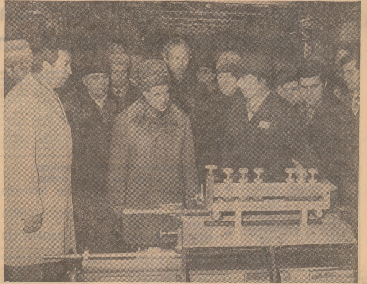
În mijlocul oamenilor muncii de la întreprinderea „Electrotimiș”

Vineri dimineață, tovarășul Nicolae Ceaușescu, secretar general al partidului, președintele republicii, a efectuat o vizită de lucru în două unități economice reprezentative pentru județul Timiș — Combinatul pentru producerea și industrializarea cărnii de porc — complexul Pădureni și întreprinderea „Electrotimiș”.