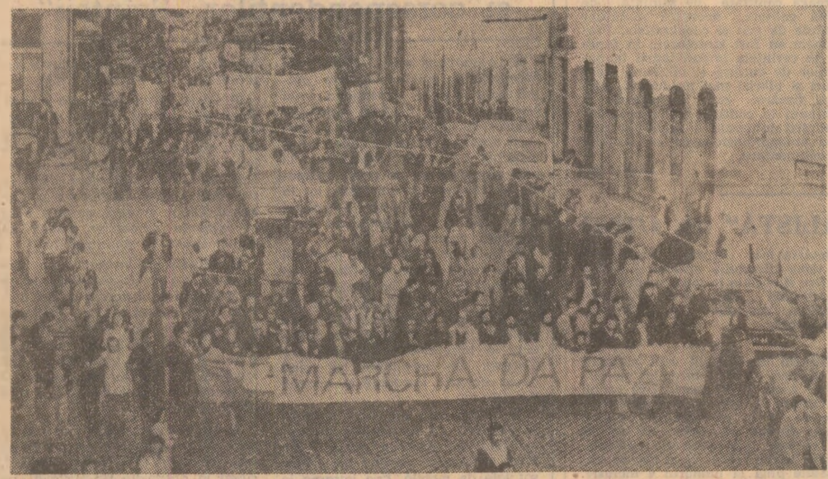
În principalele orașe ale Portugaliei s-au desfășurat recent marșuri ale păcii, în cadrul cărora participanții s-au pronunțat împotriva amplasării de rachete nucleare cu rază medie de acțiune în Europa, pentru oprirea cursei înarmării și înlăturarea dezarmării. Fotografia înfățișează un aspect din timpul marșului păcii desfășurat la Lisabona