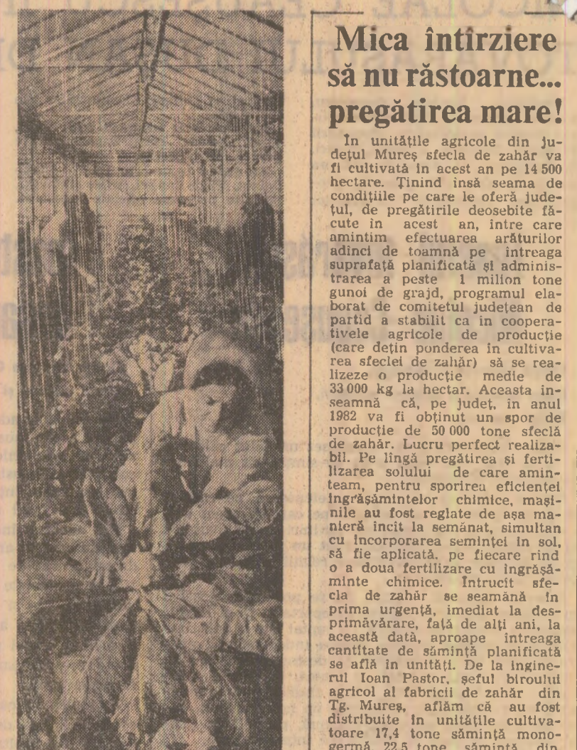
Cooperativa legumicolă Trgovște are 14 hectare de sere, din care 6 se cultivă cu legume, în alte 6 se produc răsaduri, iar două hectare sînt ocupate cu flori. Aici s-a încheiat însemnarea legumelor pentru răsadurile care vor fi plantate în solarii, iar răsadul de varză a fost repicat. Pentru prima dată aici se produc 437.000 răsaduri de tomate și varză destinate gospodării populației. Specialiștii aplică noi metode menite să sporească rentabilitatea culturilor legumelor în sere. Astfel — așa cum se vede din fotografie — între frîndurile de tomate se cultivă conopidă, salată și diferite alte verdeturi