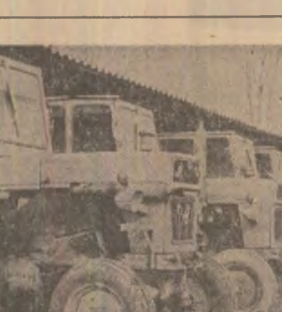
În stațiunile pentru mecanizarea agriculturii din județul Arad au fost reparate peste 4.000 de tractoare — 97 la sută din cele care vor lucra în compania agricolă de primăvară. Repararea utilajelor agricole s-a încheiat. Mecanicii din stațiuni au recondiționat piese de schimb în valoare de 15 milioane lei, care asigură reducerea cu două milioane lei a costului lucrărilor de reparații. În fotografia: la S.M.A. Sîntana se face recepția fiecărui tractor și a fiecărei mașini agricole pentru a exista garanția bunei lor funcționări în timpul lucrărilor de primăvară

du-se de la 6,6 litri la 4,5 litri/ha. În ce privește semănatul, pentru fiecare tractor „Universal 650” au fost create mai multe agregate complexe. Semănătoarea pe 8 rînduri cu fertilizator, prevăzută cu instalație de erbicide și de administrat pesticide granulate, poate realiza într-o zi 9,8 hectare, iar consumul de carburanți se reduce de la 5,3 la 4,8 litri pe hectar. La semănat se va extinde și agregatul format din