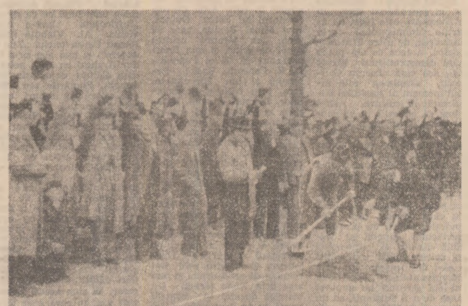
1950 Semnătură pentru un nou destin al satului