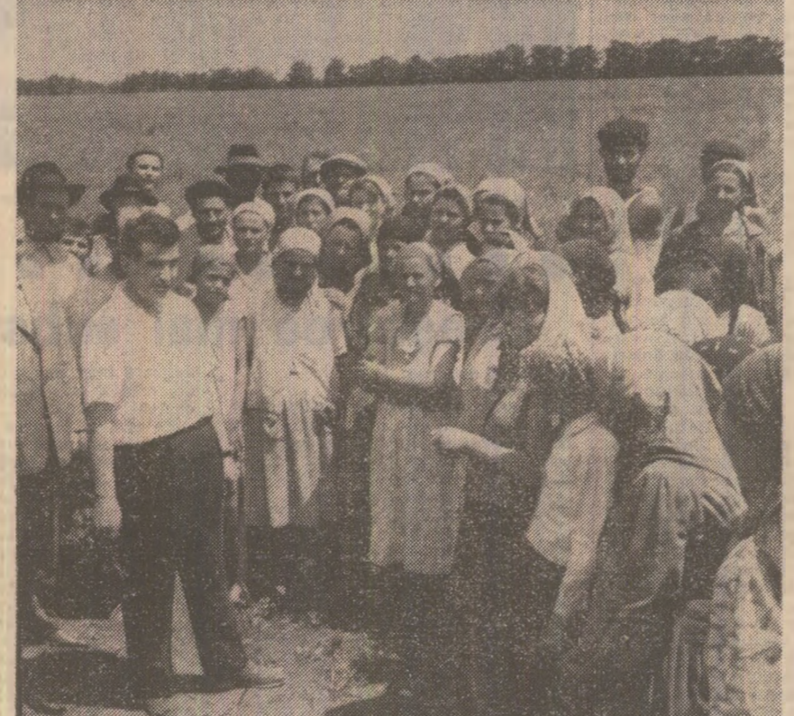
Prima vizită de lucru pe care a făcut-o tovarășul Nicolae Ceaușescu, după investirea cu cea mai înaltă răspundere în conducerea partidului, a fost printre țărani cooperatori de la C.A.P. „Gheorghe Doja“, județul Ialomița

De cîte ori sînt pus în situația să scriu despre un sat, este ca și cum mi s-ar cere să-mi fac autobiografia. Să povestesc despre vară și iarnă, despre copilărie și adolescență, despre pămîntul cîmpiei cu înfățișarea lui de piele de om, bătută de soare, bucurată de ploaie, primind veșmintele grîului și porumbului, lucrînd asupra lui însuși, neodîhnit niciodată. Am fost în zilele acestui februarie în Bărgănul Ialomițean, așternut sub viscol subțire, stringîndu-și respirația lîngă satele pregătite parcă, prin încordare, prin muncă, pentru leșirea în primăvară. Comuna Gheorghe Doja este una dintre comunele bogate ale cîmpiei, așezată temeinic în case noi, zugrăvite în ape ca în așezările de sub munte, drumuri cu asfalt, o cooperativă agricolă de producție puternică, funcționînd în toate resorturile ei ca o industrie modernă și bine pusă la punct.