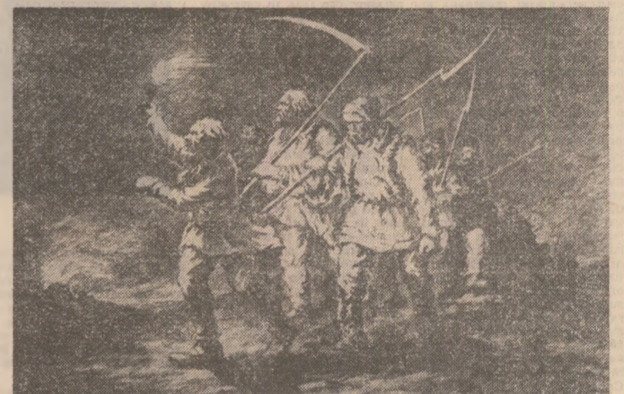
1945 O lege scrisă de țărani cu plugurile

se întinde astăzi pe 800 de hectare — adevărat motiv de mândrie pentru acești oameni harnici. Și tot ea, prin răsplată binecârmărită — cooperativa din Pechea a fost distinsă până acum, pentru rezultatele obținute, cu trei „Ordine ale Muncii” clasa I — a schimbat chipul așezării, la un pas acum de oraș