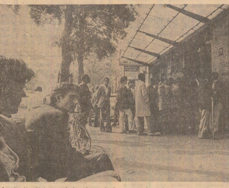
Muncitori străini așteptînd zădarnic în fața unui oficiu de recrutare a forței de muncă dintr-o suburbie a Parisului (fotografia este reprodusă din revista „L'OBSERVATEUR DE L'OCDE”).