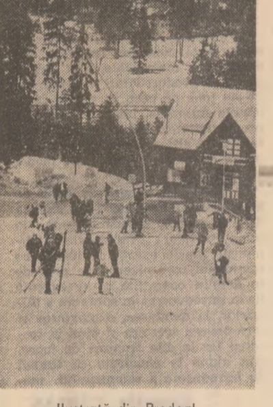
Ilustrată din Predeal