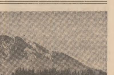
Ilustrată din Predeal