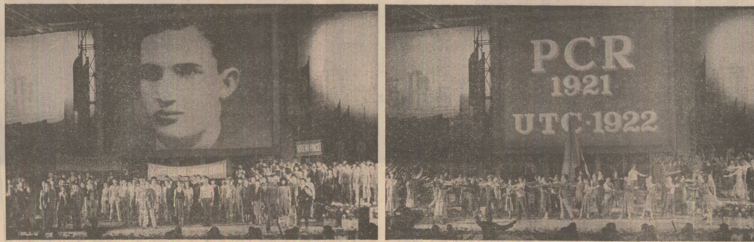
Aspecte de la spectacolul omagial

CONSILIUL UNIUNII ASOCIAȚIILOR STUDENȚILOR COMUNIȘTI DIN ROMÂNIA