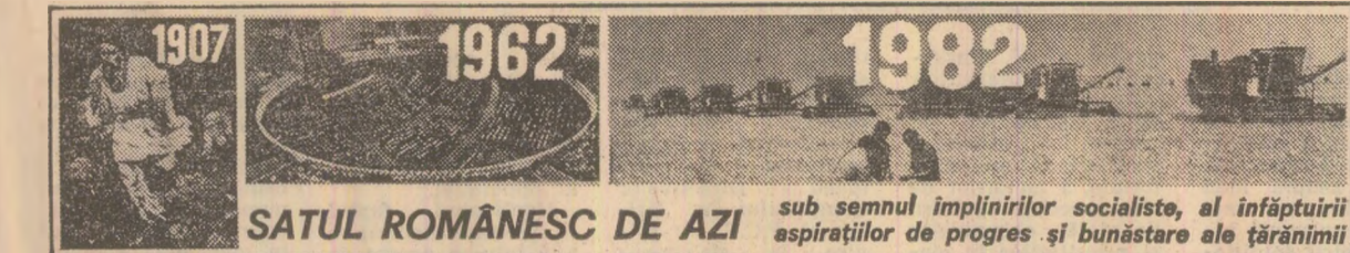
SATUL ROMÂNESC DE AZI sub semnul împlinirilor socialiste, al înfăptuirii aspirațiilor de progres și bunăstare ale tărînimii

Minerii de la Anina, cel mai vechi bazin carbonifer al țării, muncește fără preget pentru a extrage din adîncuri cantități sporite de cărbune. De la începutul anului și pînă acum, ei și-au depășit sarcinile de plan cu 3.200 tone de cărbune brut și 215 tone de cărbune spălat pentru cocs. De asemenea, minerii de aici au obținut pînă acum economii de peste 300 MWh energie electrică, 2.000 litri de benzină și 2.100 litri de motorină. (Nicolae Cătană).