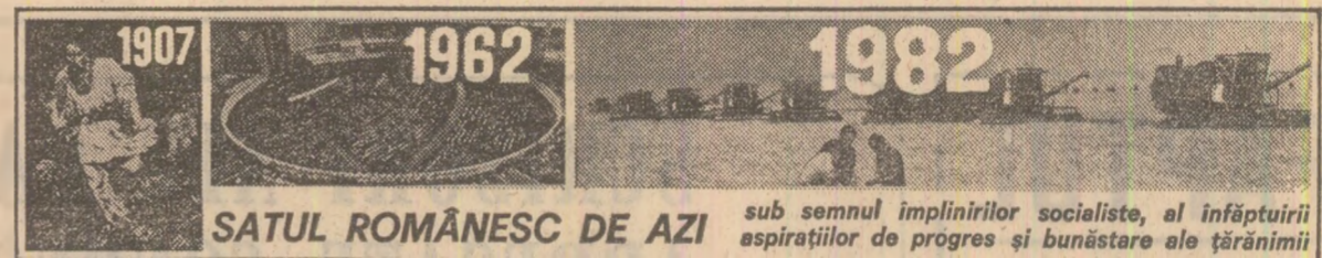
SATUL ROMÂNESC DE AZI sub semnul împlinirii socialiste, al înfăptuirii aspirațiilor de progres și bunăstare ale țărânilor

PRAHOVA. Acordînd o atenție deosebită realizării sarcinilor la export, oamenii muncii de la Întreprinderea de cartoane și cofeții din Bănești-Scăeni au reușit să producă și să livreze partenerilor externi, înainte de termen, întreaga cantitate de mărfuri prevăzută în planul primului trimestru al anului. Ca urmare a cererii expresive din partea unor firme străine, ei au livrat încă 50 tone cartoane duplex (Constantin Căpraru).