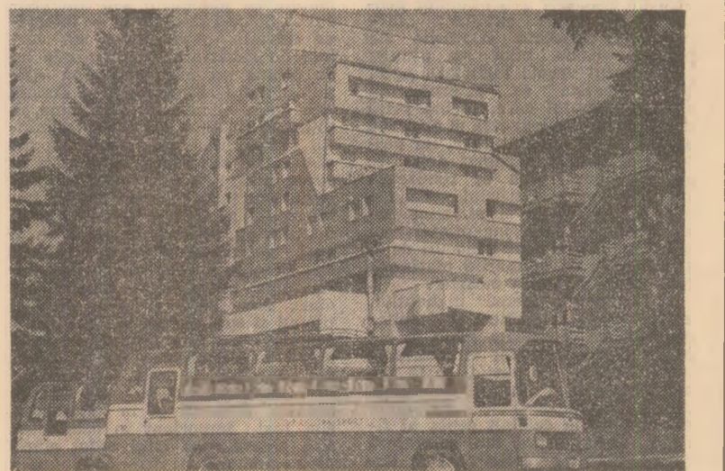
Tușnad — hotelul „Olt”

Beneficiind de asemenea luminoase tradiții, raporturile dintre România și Grecia au fost, în ultimii ani, puternic impulsionate de