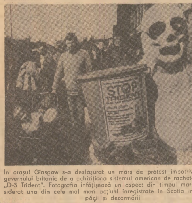
În orașul Glasgow s-a desfășurat un marș de protest împotriva deciziei guvernului britanic de a achiziționa sistemul american de rachete nucleare „D-5 Trident”. Fotografia înfățișează un aspect din timpul marșului, considerat una din cele mai mari acțiuni înregistrate în Scoția în favoarea păcii și dezarmării.