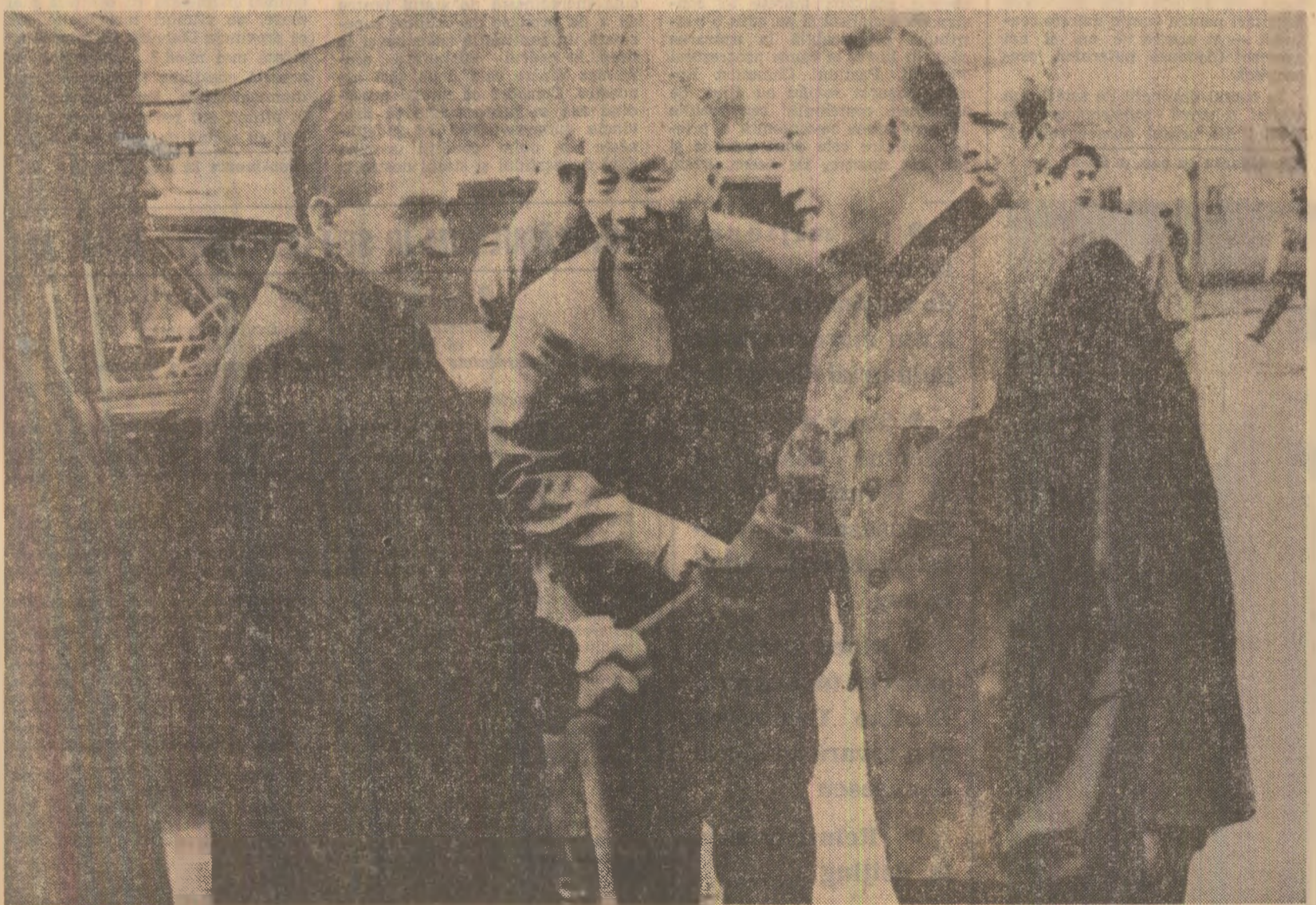
Imagini din timpul vizitei la Uzina de mașini-unelte nr. 3 din Shenyang