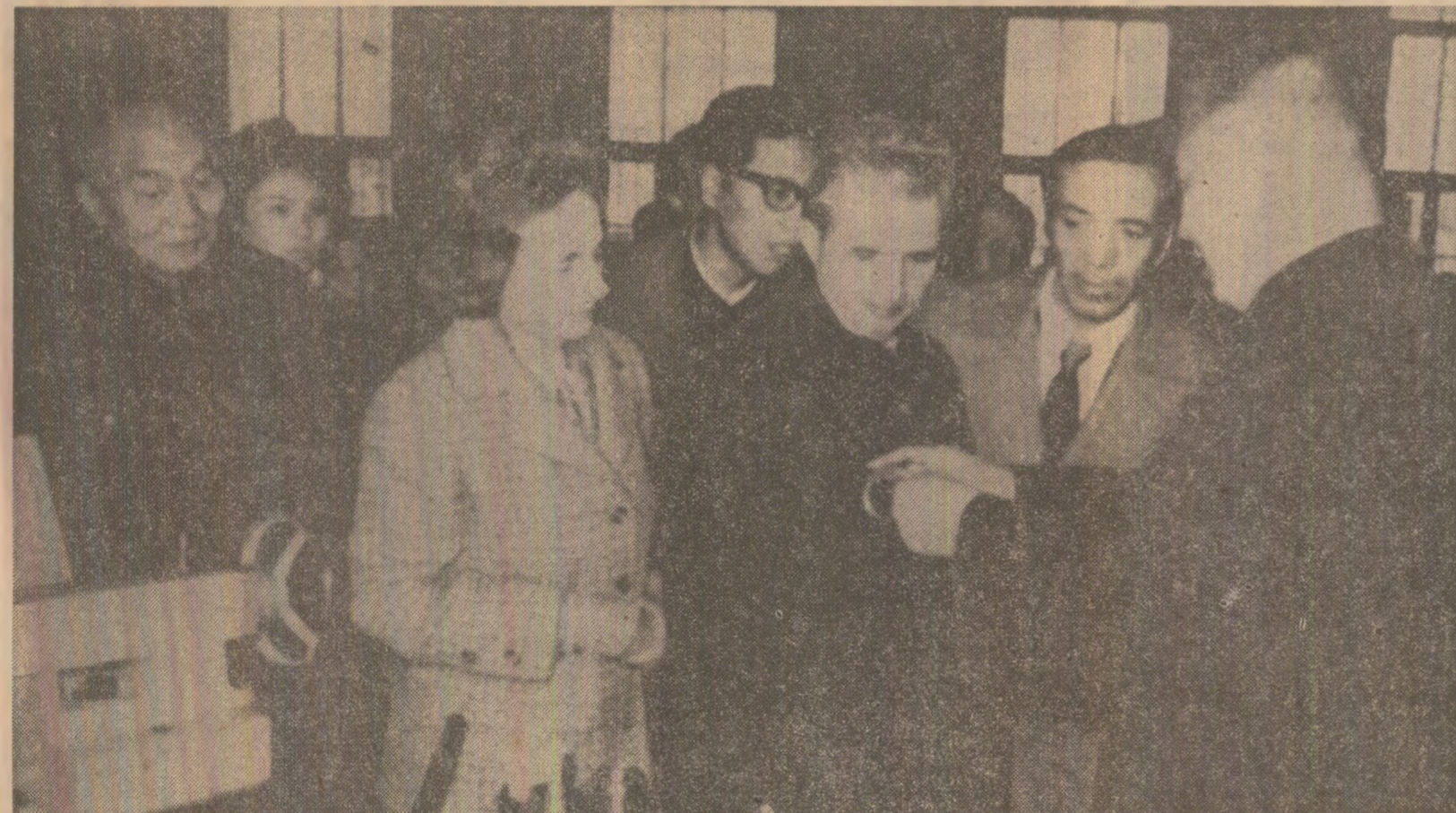
Înalții oaspeți le sînt prezentate produse realizate de colectivul Uzinei de mașini-unelte nr. 3 din Shenyang

• In mijlocul muncitorilor Uzinei de mașini-unelte nr. 3 din marele centru industrial Shenyang