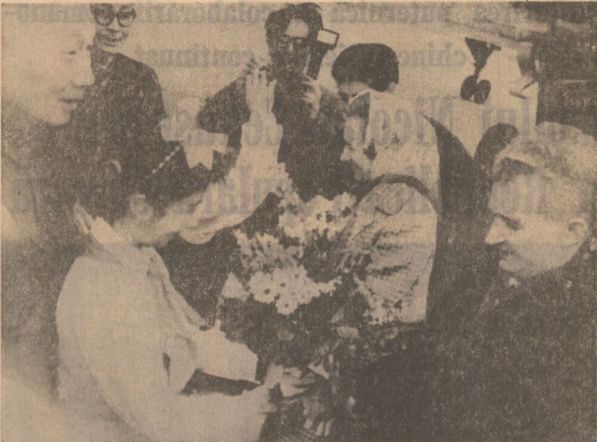
Sosirea înalților oaspeți pe aeroportul din Shenyang