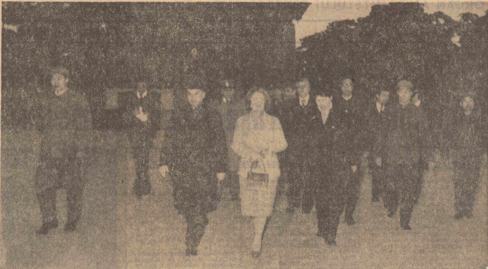
Aspect din timpul vizitării principalelor artere și cartiere ale străvechiului oraș Shenyang