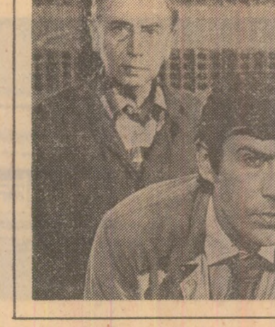
Flori albe de mal

Manifestarea va avea loc și în municipiul Constanta în perioada 4—7 mai.