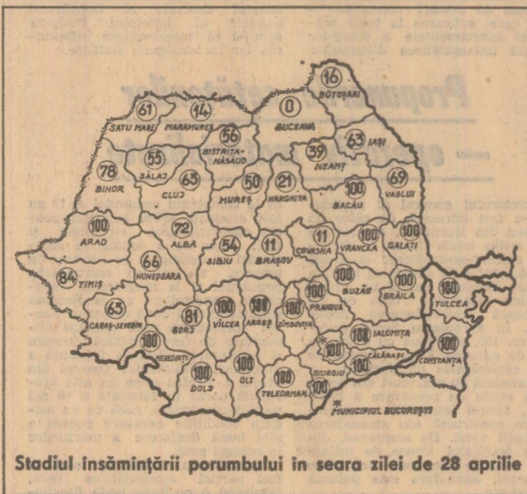
Stadiul însămînțării porumbului în seara zilei de 28 aprilie

În ultimele zile, în jumătatea de nord a țării a plouat, iar pe aici chiar a nins. Aceste fenomene meteorologice, neobișnuite pentru acest sezon, nu împiedică desfășurarea normală a lucrărilor de pregătire a terenului și semănat. În zonele unde evoluția timpului a permis, lucrările în câmp au continuat cu intensitate. În unitățile agricole din județul Timiș, bunăoară, prin utilizarea din plin a mijloacelor mecanice viteză zilnică de lucru la semănat a sporit la 27.000-28.000 hectare, fiind superioară celei planificate. Și în alte județe au fost bine folosite „ferestrele” dintre ploți, suprafețele însămînțate crescând cu fiecare zi.