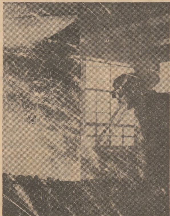
Pe platforma Combinatului siderurgic Galați, prezenți lângă vetele fierbinți ale coșurilor, furnalelor, oțelăriei nr. 1 s-au elaborat, pești prevederi, 1 100 tone oțel.

de peste 30 tone oțel de bună calitate. La comitetul de partid al combinatului ne notăm depășirile de plan în primele două zile ale începutului de mai: 65 tone coals metalurgic, 90 tone fontă, 180 tone oțel și 125 tone laminat”. Un început frumos, promițător pentru întreaga lună mai, când în fața siderurgistilor hunedoreni stau sarcini de mare răspundere pentru realizarea planului la producția fizică și la export, în condiții de înaltă eficiență. Dar zilele începutului de mai n-au însemnat, la Hunedoara, numai muncă. Deși timpul nu a fost călduros, numeroși locuitorii ai acestei cetăți muncitorești, împreună cu familiile lor, s-au îndreptat spre cunoscutele locuri de odihnă și agrement — pădurea Chizid și lacul Cincis. Buna