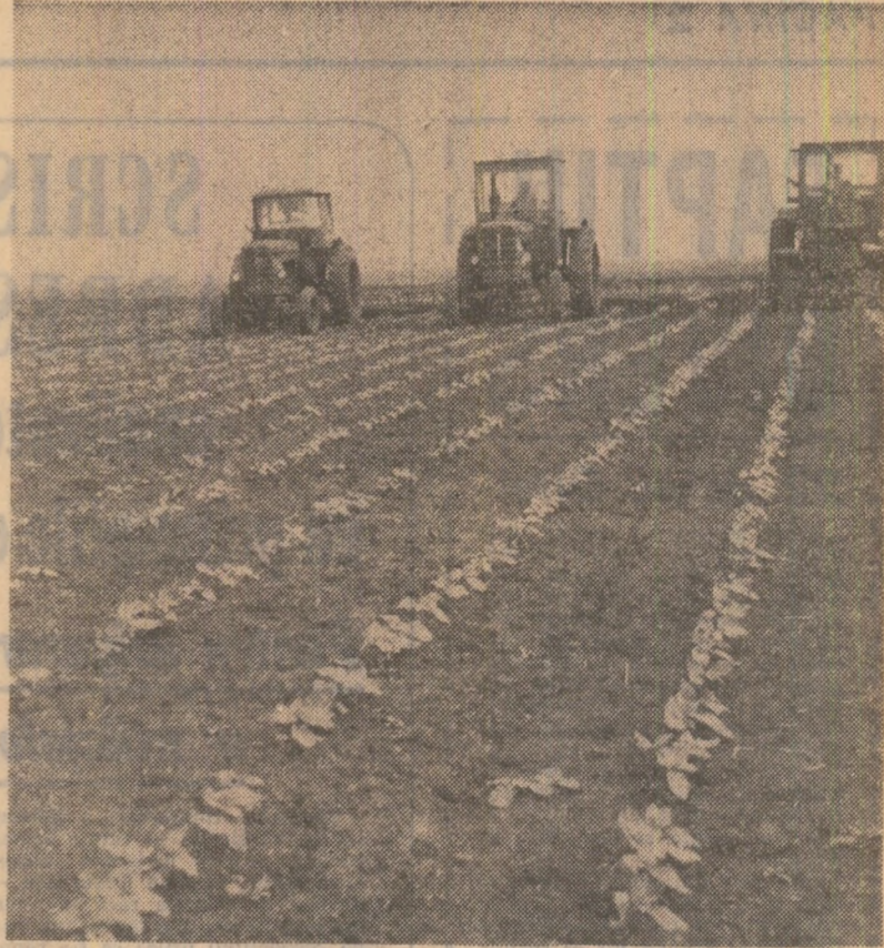
In aceste zile, lucrările de întreținere a culturilor se desfășoară tot mai intens în cooperativă și întreprinderile agricole din județul Teleorman. La floarea-soarelui, de exemplu, au fost preluate mecanic peste 11 000 hectare, în fața stăruinței unităților din consiliile agroindustriale Purani, Blejești, Slobozia-Mindra și Salcia. Până acum, cele mai bune rezultate le-au obținut țărani cooperatori și mecanizatorii din unitățile consiliului agroindustrial Purani (în fotografie), unde s-au preluat peste 1 700 hectare din cele 2 500 hectare cultivate