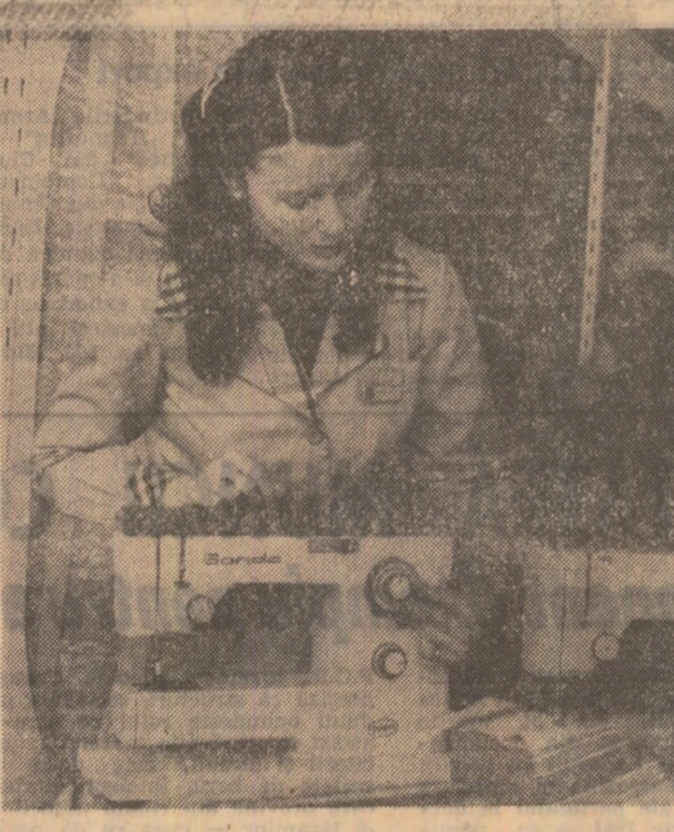
Un ajutor prețios pentru toate gospodinele: Mașina de cusut „Sanda”

Este o mașină automată pentru cusături decorative și utilitare, realizată la nivelul celor mai bune produse similare din străinătate. Mașina electrică de cusut „Sanda” execută numeroase operațiuni: cusătură dreaptă (cu un ac sau cu ac dublu); cusătură în zig-zag; tiv invisibil; tiv înqast; mediu și lat; tivirea și conometul, aplicarea danțelii; cusătură cu răbaterrea materialului; cusătură paralelă cu marginea materialului; coaserea înainte și înapoi; coaserea nervurilor; coaserea snururilor; coaserea nasturilor; butoniere (netede sau în relief); stopat; văluri, surfilat; broderie; 16 modele de cusături decorative (cu un ac sau cu ac dublu), 6 cusături utilitare, elastice (cu un ac sau cu ac dublu). Mașina electrică de cusut „Sanda” se poate procura de la magazinele și raioanele socializate ale comerțului de stat.