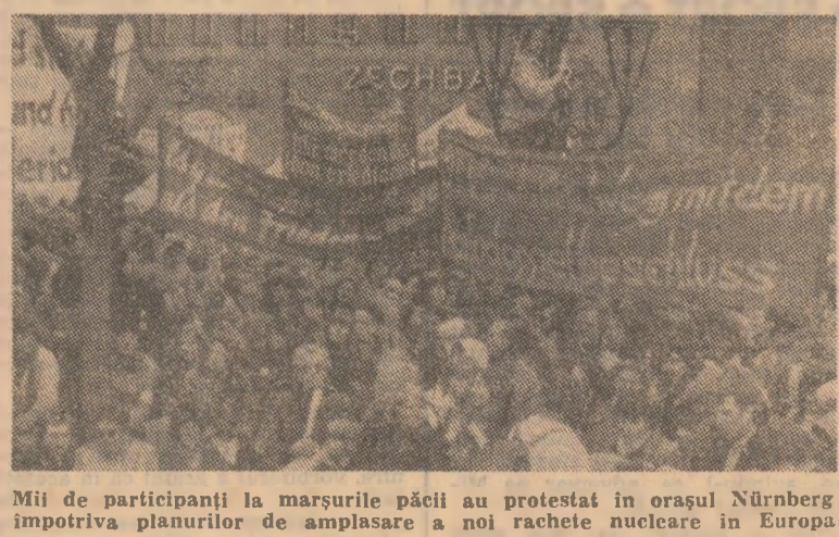
Mii de participanți la marșurile păcii au protestat în orașul Nürnberg împotriva planurilor de amplasare a noi rachete nucleare în Europa.

BONN 12 (Agerpres) — Într-un interviu acordat săptămânalului vest-german „Vorwärts”, cunoscutul om politic suedez, fost prim-ministru, Olof Palme, prezidente Comisiei independente pentru securitate și dezarmare, a scos în evidență faptul că, rațional, în spiritul înțelepciunii umane, nu este de conceput utilizarea armelor nucleare, întrucât ar conduce la distrugerea totală a omenirii. Olof Palme a respins categoric valabilitatea afirmațiilor privind posibilitatea desfășurării unui război nuclear „limitat”.