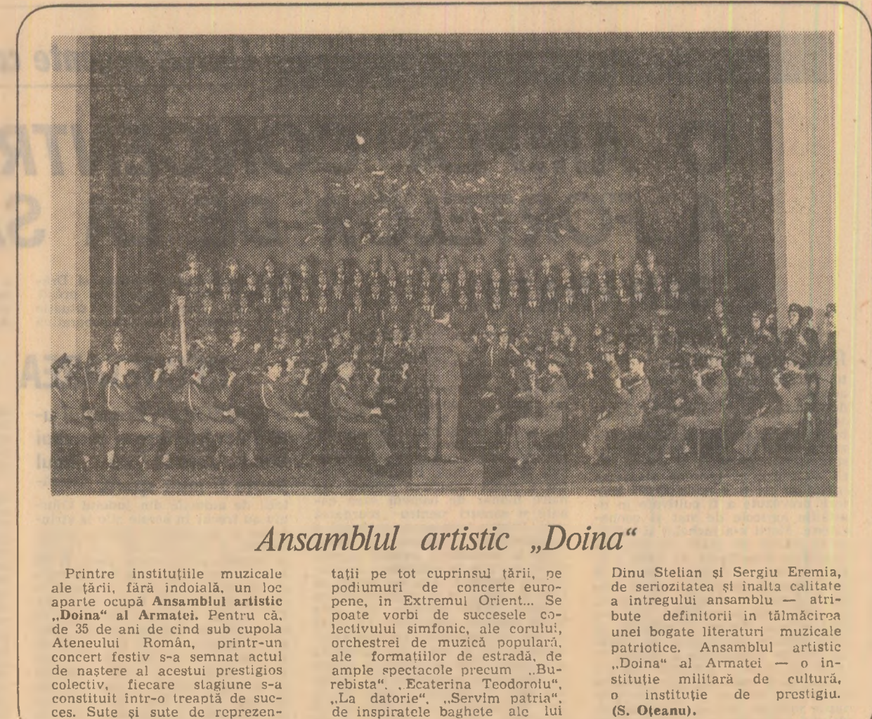
Ansamblul artistic „Doina”

Printre instituțiile muzicale ale țării, fără îndoială, un loc aparte ocupă Ansamblul artistic „Doina” al Armatei. Pentru că de 35 de ani de cînd sub cupola Ateneului Român, printr-un concert festiv s-a semnat actul de naștere al acestui prestigios ansamblu artistic. El este constituit într-o trează de succes. Sute și sute de reprezen-