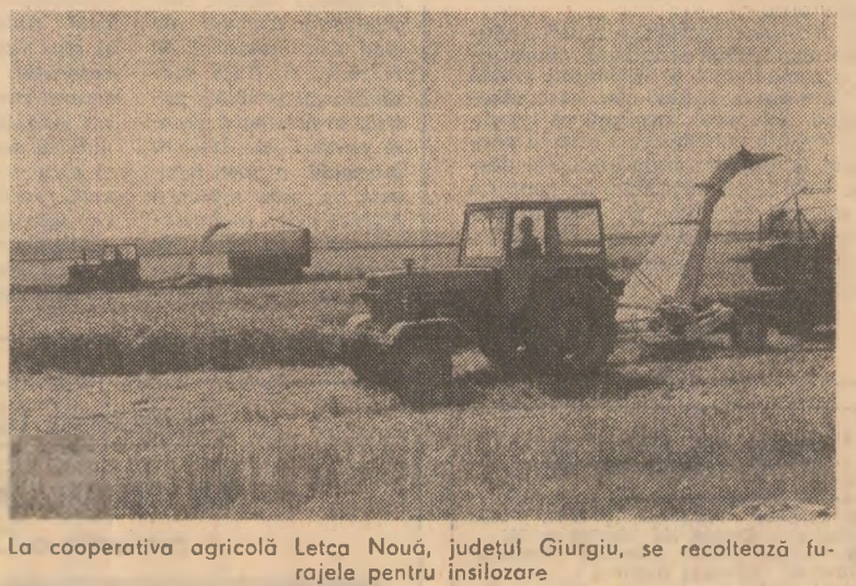
La cooperativa agricolă Letca Nouă, județul Giurgiu, se recoltează furajele pentru insilozare