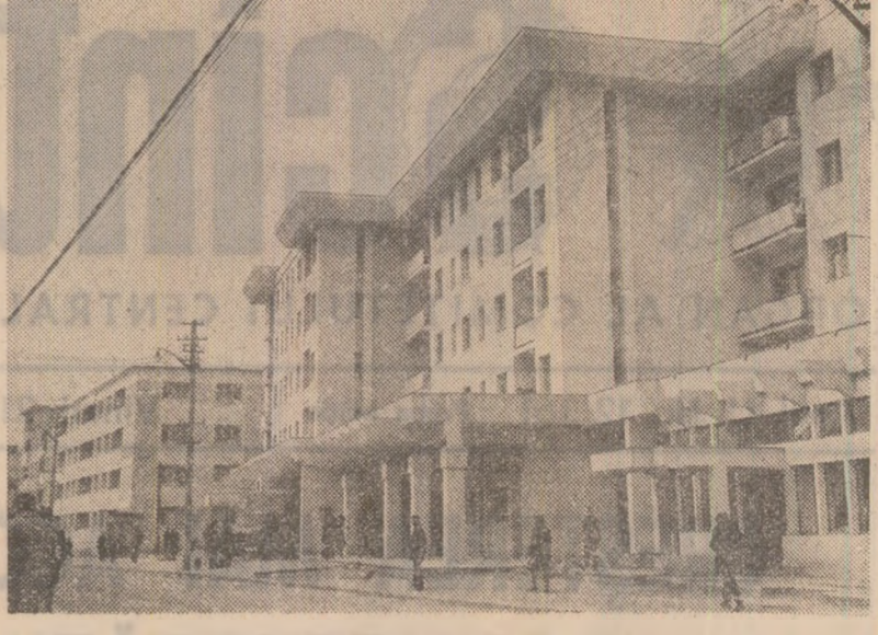
Construcții noi de locuințe la Moinesti.