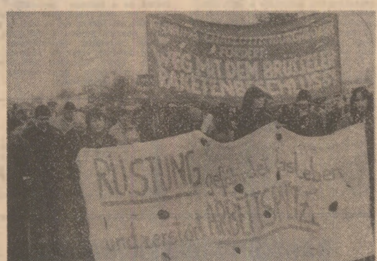
50 000 de vest-berlinezi au participat, zilele trecute, la o mare demonstrație împotriva planurilor N.A.T.O. de amplasare a noi rachete nucleare în Europa...