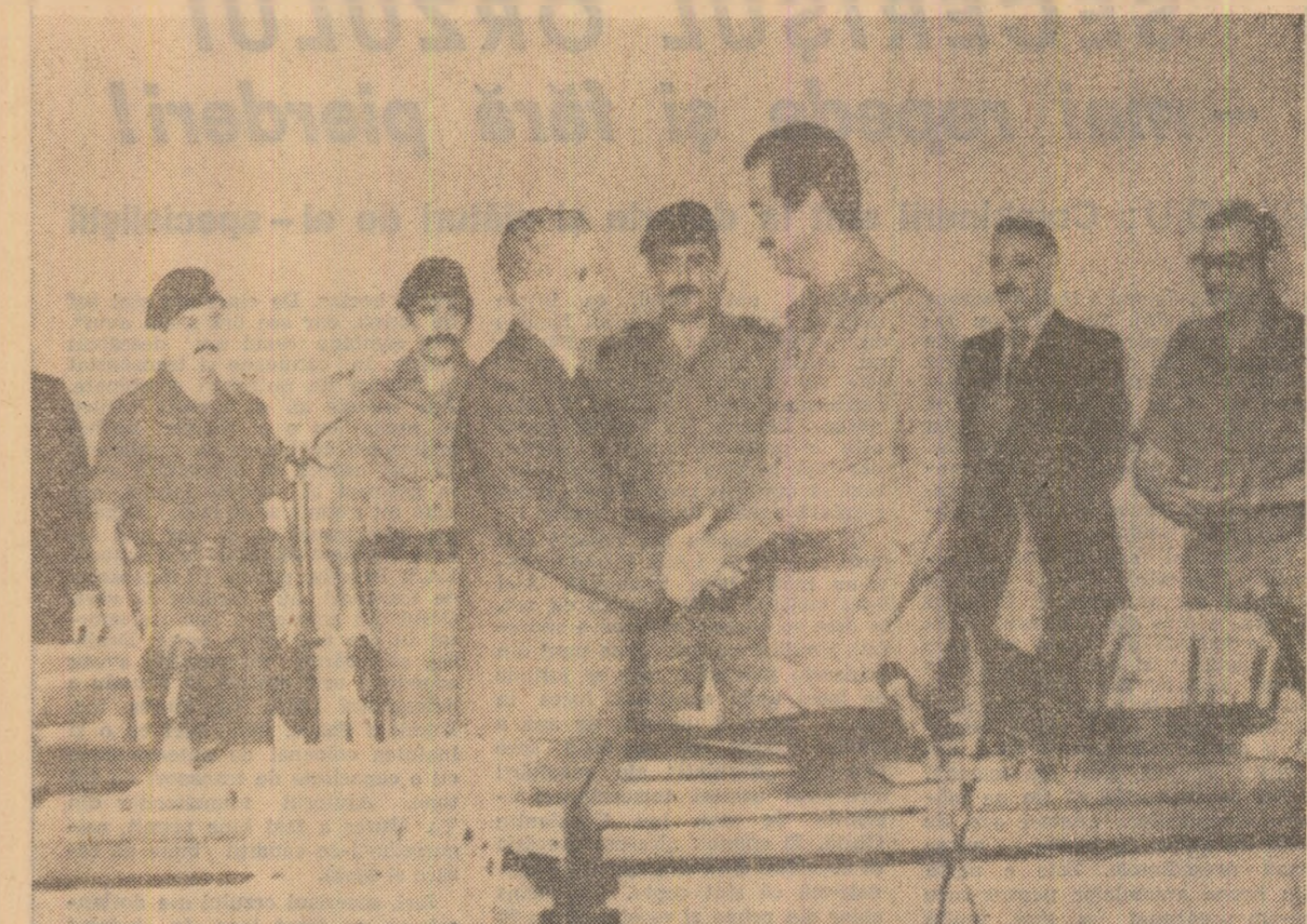
După semnarea documentelor oficiale

și poporului român de condamnare a acestei acțiuni agresive a Israelului, care complică și mai mult situația din Orientul Mijlociu și îndepărtează șansele realizării unei păci globale, juste și durabile în această zonă atât de frământată a lumii. S-a relevat necesitatea de a se acționa cu hotărâre pentru încetarea imediată a agresiunii israeliene și retragerea neîntârziată a trupelor Israelului din Liban. În cadrul convorbirilor, președintele Nicolae Ceaușescu și președintele Saddam Hussein au relevat buna conlucrare existentă între România și Irak, pe plan internațional, și au exprimat necesitatea ca țările nealiniate și țările în curs de dezvoltare să-și intensifice colaborarea între ele, în cadrul O.N.U., al mișcării țărilor nealiniate, al „Grupului celor 77” și în alte forumuri internaționale. În acest context s-a apreciat că apropiata conferință la nivel înalt a țărilor nealiniate, care se va desfășura anul acesta la Bagdad, va aduce o însemnată contribuție la îmbunătățirea climatului internațional și la creșterea rolului mișcării de nealinieri în viața internațională. Convorbirile s-au desfășurat într-o atmosferă de prietenie, înțelegere și respect reciproc.