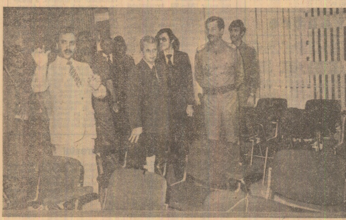
Aspecte din timpul vizitării noului centru civic al Bagdadului