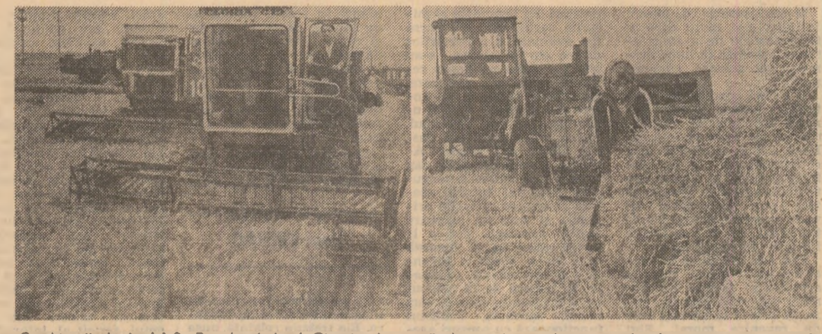
Combinerii de la I.A.S. Prundu, județul Giurgiu, lucrează de zor la recoltarea orzului (fotografia din stînga), iar în urma lor presele de balotat adună palele, lăsînd terenul liber în vederea însemnării celei de-a doua culturi (fotografia din dreapta)